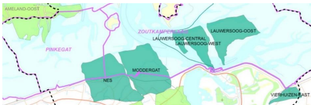
Figuur 1: Ligging gasvelden Nes, Moddergat, Lauwersoog C, Lauwersoog West, Lauwersoog Oost en Vierhuizen Oost (in donkergroen) binnen de kombergingsgebieden Pinkegat en Zoutkamperlaag (in paars).

De Nederlandse Aardolie Maatschappij BV (NAM) heeft van het Rijk toestemming om aardgas te winnen uit de zes velden Moddergat, Nes, Lauwersoog C, Lauwersoog West, Lauwersoog Oost en Vierhuizen Oost in het Waddenzeegebied (verder MLV-gasvelden). De winning is gestart in 2007.