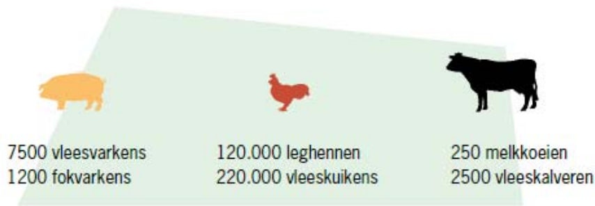
Figuur 3.1 Maximale dieren aantallen bouwvlak 1 tot 1.5 ha