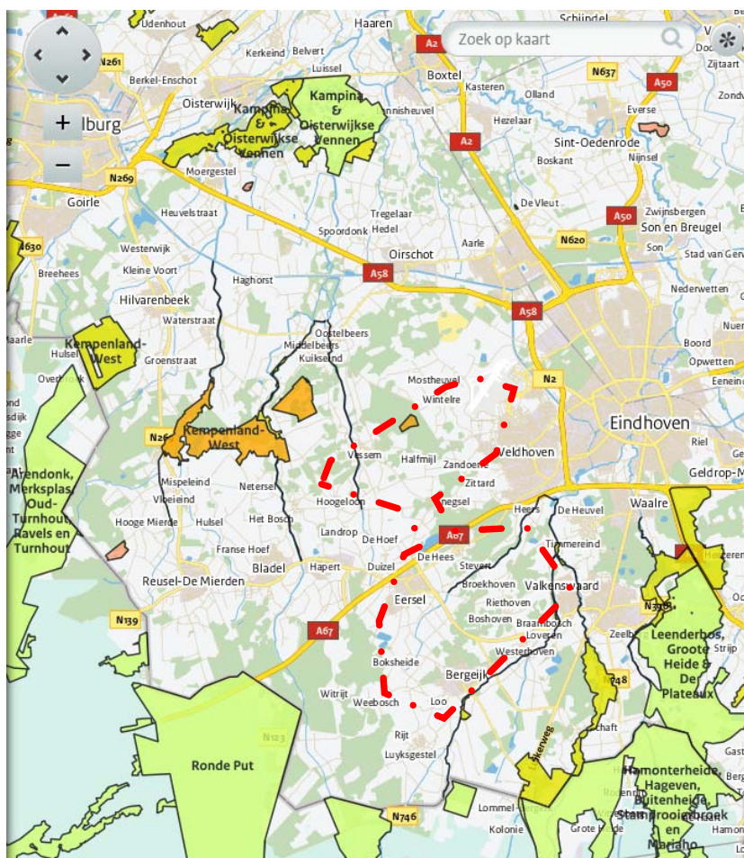
Figuur 1 Natura 2000-gebieden en beschermde natuurmonumenten in en nabij de gemeente Eersel

Deze gebieden zijn maatgevend voor de verder weg gelegen gebieden, zoals 'Weerter- en Budelerbergen & Ringselven, Grote Peel en Regte Heide & Riels Laag'. Naarmate de afstand tot het plangebied toeneemt, nemen de effecten, waaronder de stikstofdepositie, af.