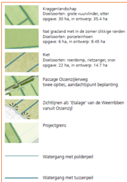
Voorbeeld van een schetsontwerp Verbindingszone Rottige Meenthe-Weerribben