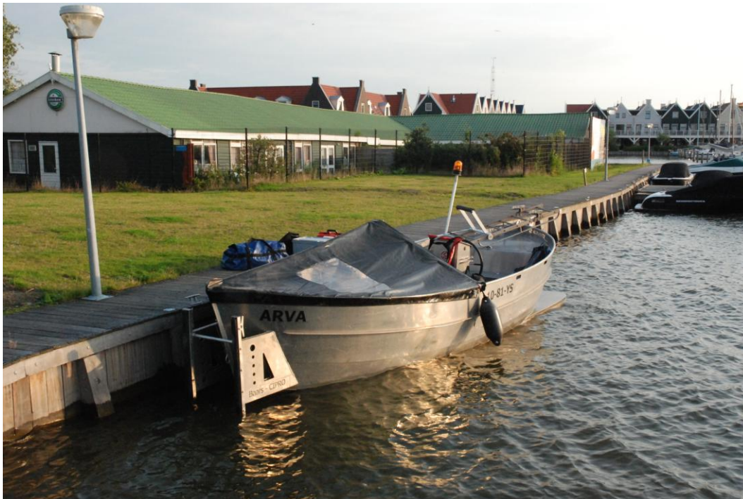
Afb. 3. De Arva.

Het duikonderzoek is uitgevoerd vanaf het vaartuig De Arva. Dit vaartuig is 7 m lang, 2,50 m breed en heeft een minimale kruiplijn. De Arva beschikt over een 60PK outboard in bun (0-45 km/h), zwaailamp, marifoon en optioneel 230V tot 5000W (via accu's). Het vaartuig is ten behoeve van het onderzoek uitgerust met dGPS, een surface supplied duikuitrusting en een duikvideo-uitrusting. Op de onderzoekslocaties werd gepositioneerd door middel van een anker.