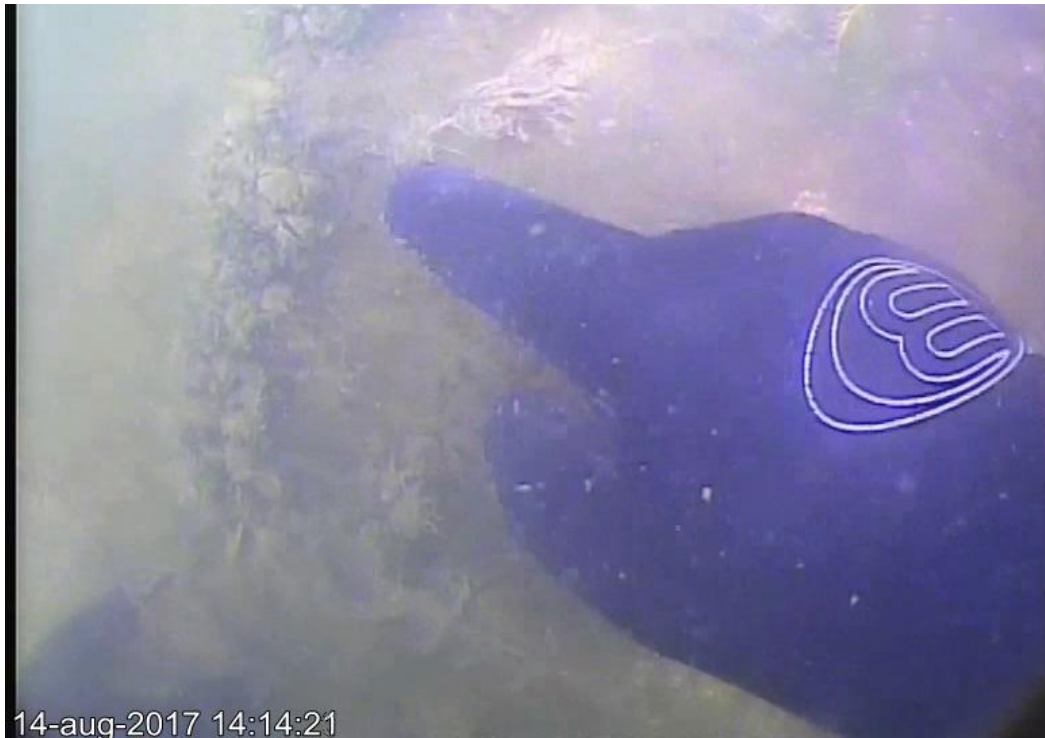
Afb. 10. Mag 348: ijzeren vat, vinger wijst de rand aan.

Op deze locatie is een half ijzeren vat aangetroffen. Het ligt met de open kant naar boven en de randen steken uit de bodem.