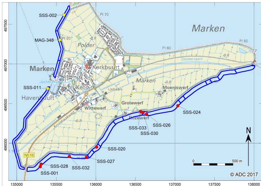
Afb. 2. Het plangebied met daarin weergegeven de duiklocaties.