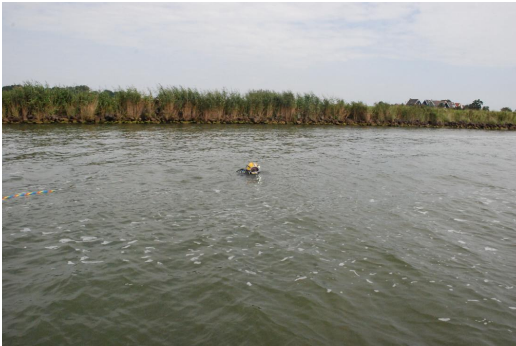
Afb. 5. Duikwerkzaamheden langs de dijk bij Marken.

Naar aanleiding van het vooronderzoek zijn in totaal 12 locaties met mogelijke archeologische resten onderscheiden. Elf locaties vormden zichtbare anomalieën op de side scan sonaropnamen, één locatie is geselecteerd op basis van magnetometeronderzoek. De resultaten worden hieronder in detail besproken. Bij de beschrijving van de locaties worden ter illustratie screenshots van de duikfilms weergegeven.