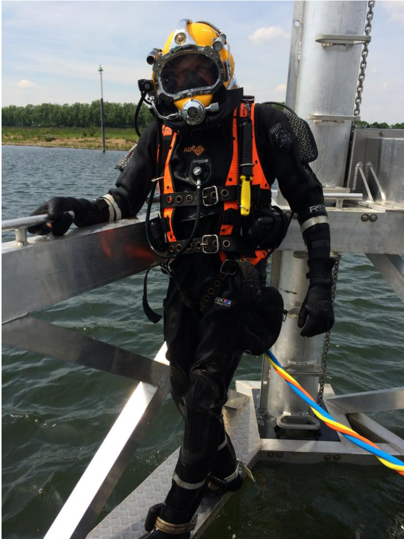
Afb. 4. De SSE duikuitrusting met duikhelm.