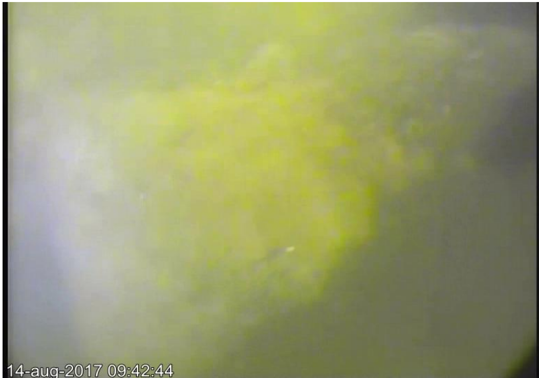
Afb. 7. SSS contact 20: een van de breukstenen (ca. 40 bij 20 cm).

Tijdens de duikinspectie zijn op deze locatie diverse losse stenen aangetroffen. Het betreft breukstenen van basalt met afmetingen van 30 bij 30 cm en groter (60 bij 60 cm). Ze liggen op de schelpenafzettingen van de Zuiderzee. Tussen deze stenen liggen hier en daar bakstenen. De bodem bestaat uit zeer zandige klei, met daarop mariene schelpen.