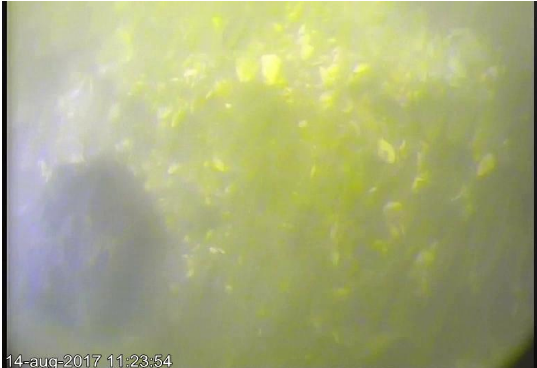
Afb. 9. Losse steen (10 bij 15 cm) op de schelpenbodem bij SSS 32

Sonarcontact 32 is beschreven als een langwerpige matige reflectie met lichte schaduw van een groot object (11 meter). Er bevinden zich meerdere reflecties omheen. Tijdens de duikinspectie is vastgesteld dat hier relatief veel stenen bij elkaar liggen. Opvallend is een platte steen van 50 bij 50 cm die deels in de bodem ligt. Omdat deze afwijkende steen onderdeel uitmaakt van een geheel van veelvoorkomende dijkstenen, wordt het sonarcontact geïnterpreteerd als een stortlocatie. De bodem bestaat uit een dunne laag mariene schelpen op klei.