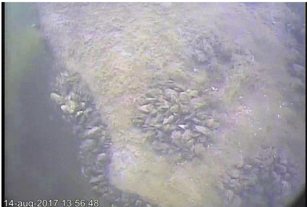
Afb. 6. SSS contact 2: breuksteen (ca. 40 bij 40 bij 20 cm).

Op de locatie van sonarcontact 2 is een cluster dijkstenen aangetroffen met een grootte van ca 40 bij 40 bij 20 cm. Ze liggen buiten de lijn van het dijktralud en zijn om deze reden onderscheiden als anomalie. De bodem op deze locatie bestaat uit een laag mariene schelpen op zandige klei.