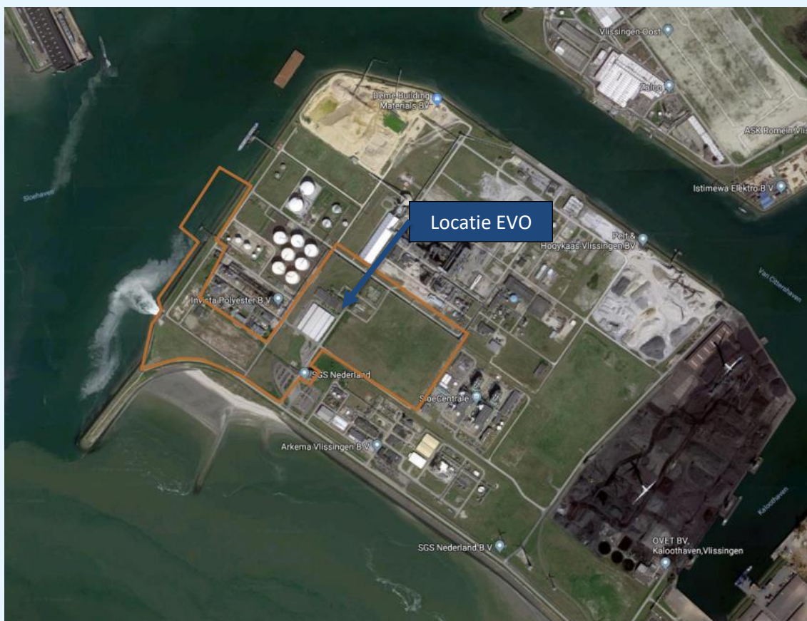
figuur 2: situatie

De omgeving van de locatie ETBV is weergegeven op onderstaande luchtfoto.