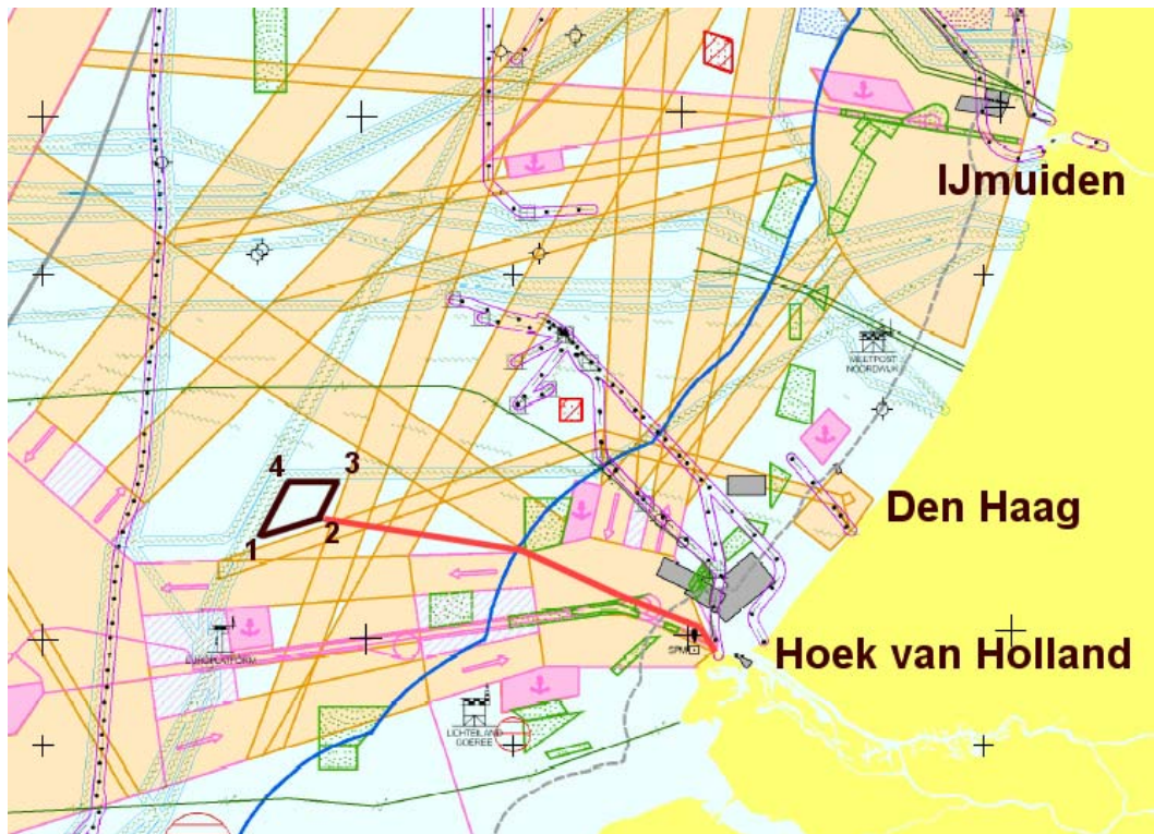
Figuur 1: Locatie Offshore Windpark Den Haag II

De coördinaten van de 4 hoekpunten van het windpark zijn in onderste tabel aangeven.