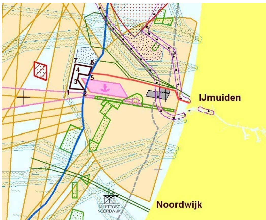
Figuur 1: Locatie Offshore Windpark IJmuiden

De coördinaten van de 7 hoekpunten van het windpark zijn in onderste tabel aangeven.