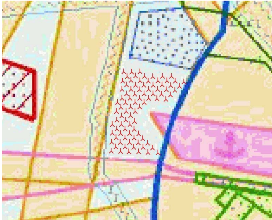
Figuur 2: Compacte variant met turbines uit de 3 MW klasse