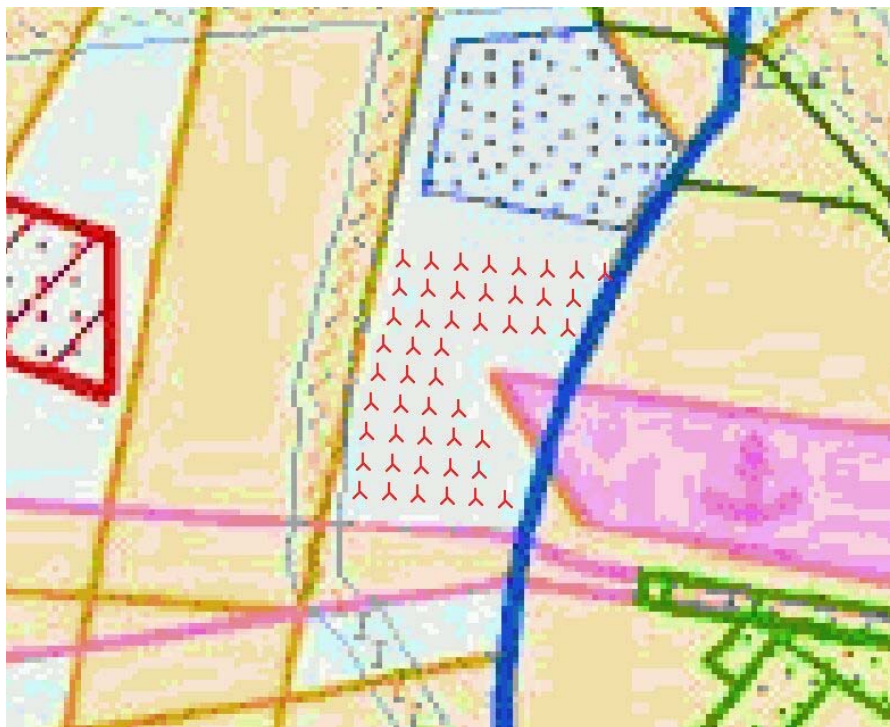
Figuur 3: Basisvariant met turbines uit de 3 MW klasse

Uit het I-MER NSW is tevens naar voren gekomen dat overige vormen van het windpark weinig tot geen toegevoegde waarde hebben ten opzichte van bovengenoemde