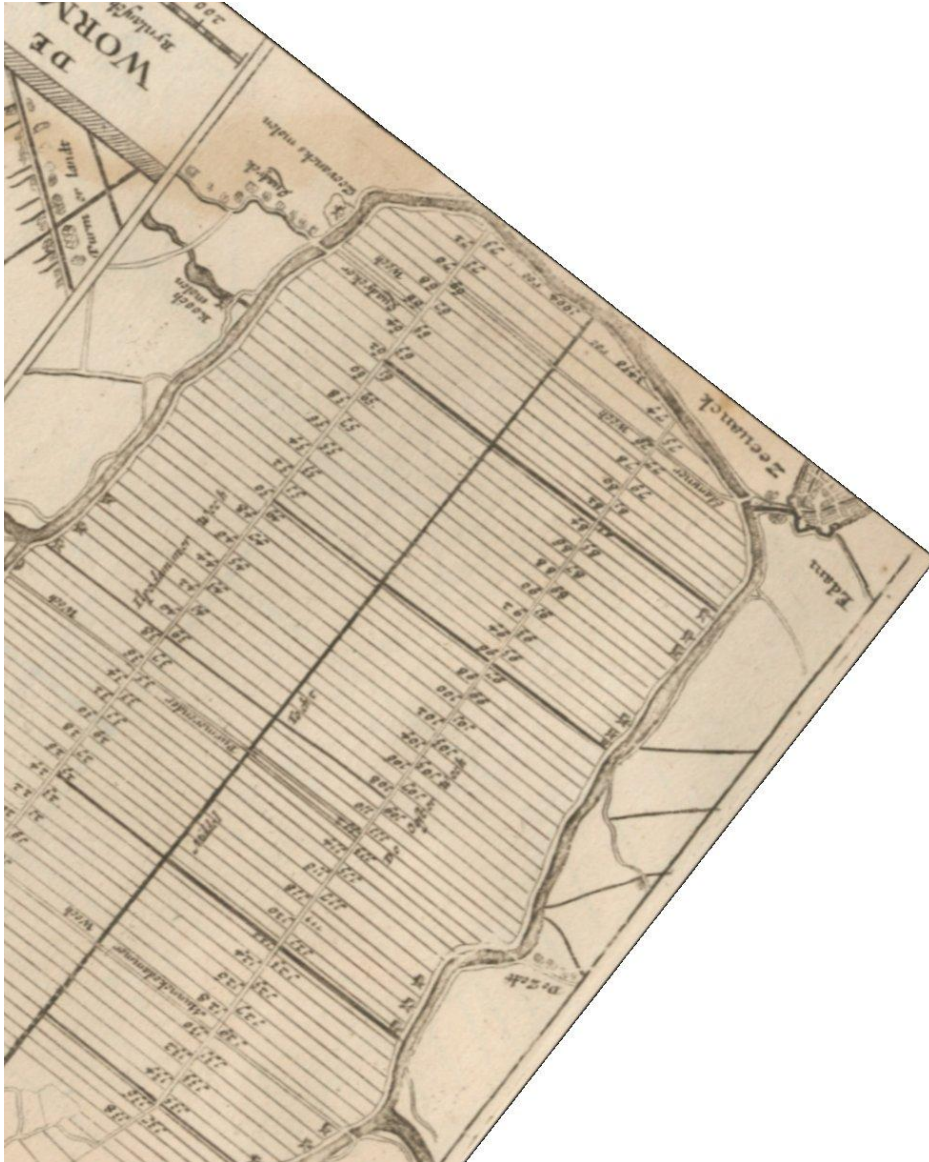
Noordelijk deel van de Purmer naar 'de Vyerighe Colom' 1696, kaart zodanig gedraaid dat het noorden boven staat.