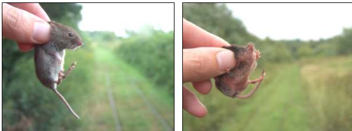
Figuur 2. Beeld van een vangst van rosse woelmuis (links) en bosspitsmuis (rechts).

Alle waargenomen grondgebonden zoogdieren zijn licht beschermd via de Flora- en faunawet en niet bedreigd volgens de Rode lijst.