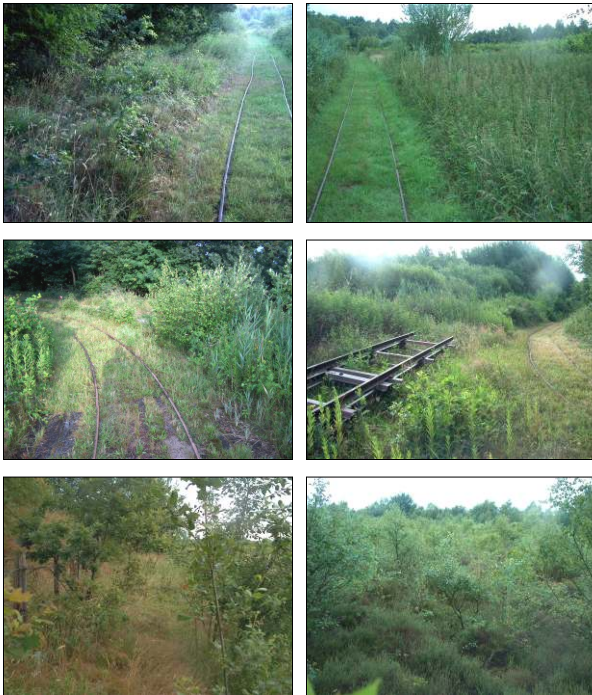
Figuur 2. Beeld van de vangstlocaties (boven: locatie A, midden: locatie B, onder: locatie C).

De hier geschetste methode sluit aan op de IBN+-methode (Bergers et al., 2000), met dien verstande dat ook overdag werd gevangen. Met de IBN+-methode wordt een soort, per locatie (40 vallen) met 95% zekerheid gevangen. Zowel theoretisch als praktisch kan dus een soort aanwezig zijn, met dien verstande met een lage dichtheid. In totaal zijn 120 vallen opgesteld, op drie locaties (6 raaien). De raaien zijn niet homogeen verdeeld over het gebied omdat in het meest geschikte ecotoop is gevangen (meerjarige kruidachtige vegetaties).