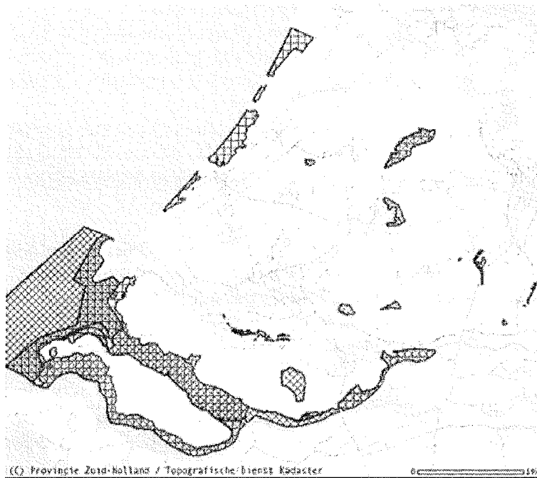
Figuur 2 Natura 2000 gebieden in Zuid-Holland

Stap 1 Inventarisatie kan in deze NRWD maar beperkt worden uitgevoerd. De effecten van de Provinciale Structuurvisie zijn nu nog niet zo duidelijk dat de betreffende gebieden al aan te wijzen zijn. We moeten ons dus beperken tot de uitspraak dat een voortoets zal plaatsvinden in de planMER, zodra de effecten van de planalternatieven daar aanleiding toe geven.