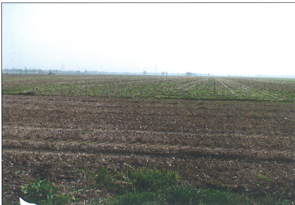
Foto 1: Het plangebied gelegen aan de Westerveldweg, kadastraal sectie W 83 te Dalfsen

De omgeving van het plangebied bestaat eveneens uit agrarisch land.