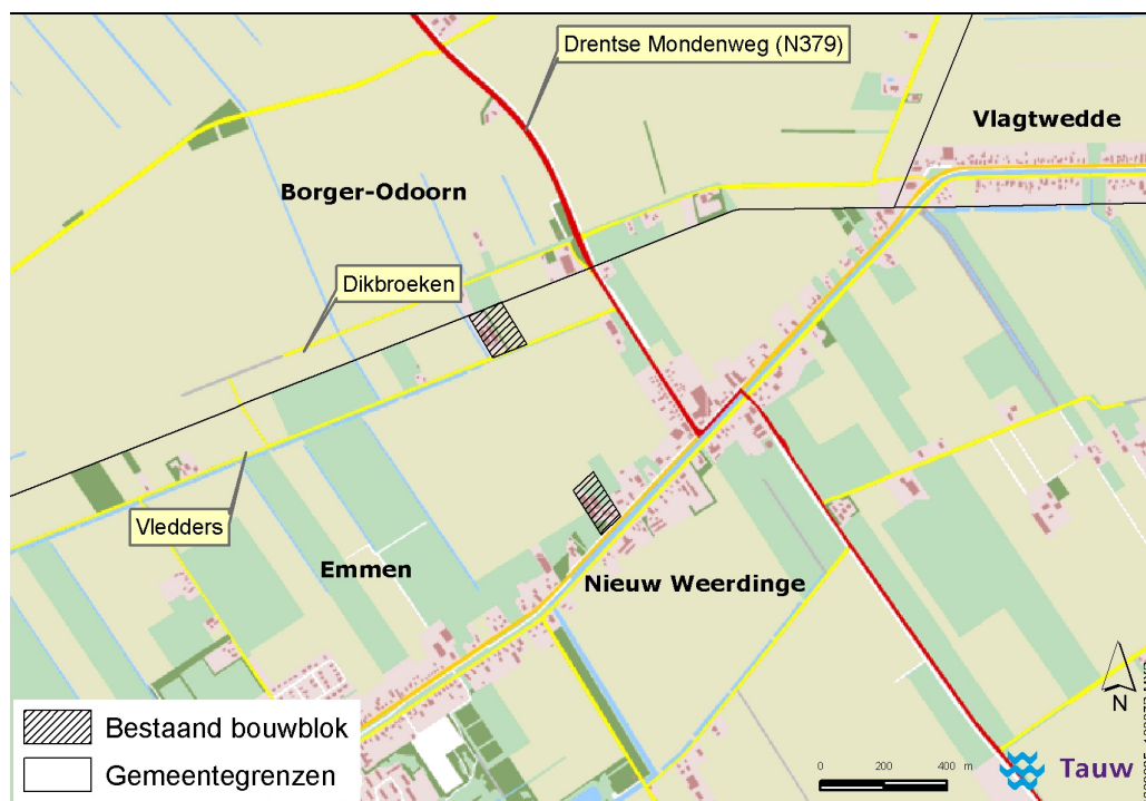
Figuur 1.1 Bestaande bouw pluimveehouderij v.o.f. Haan te Nieuw Weerdinge, gemeente Emmen