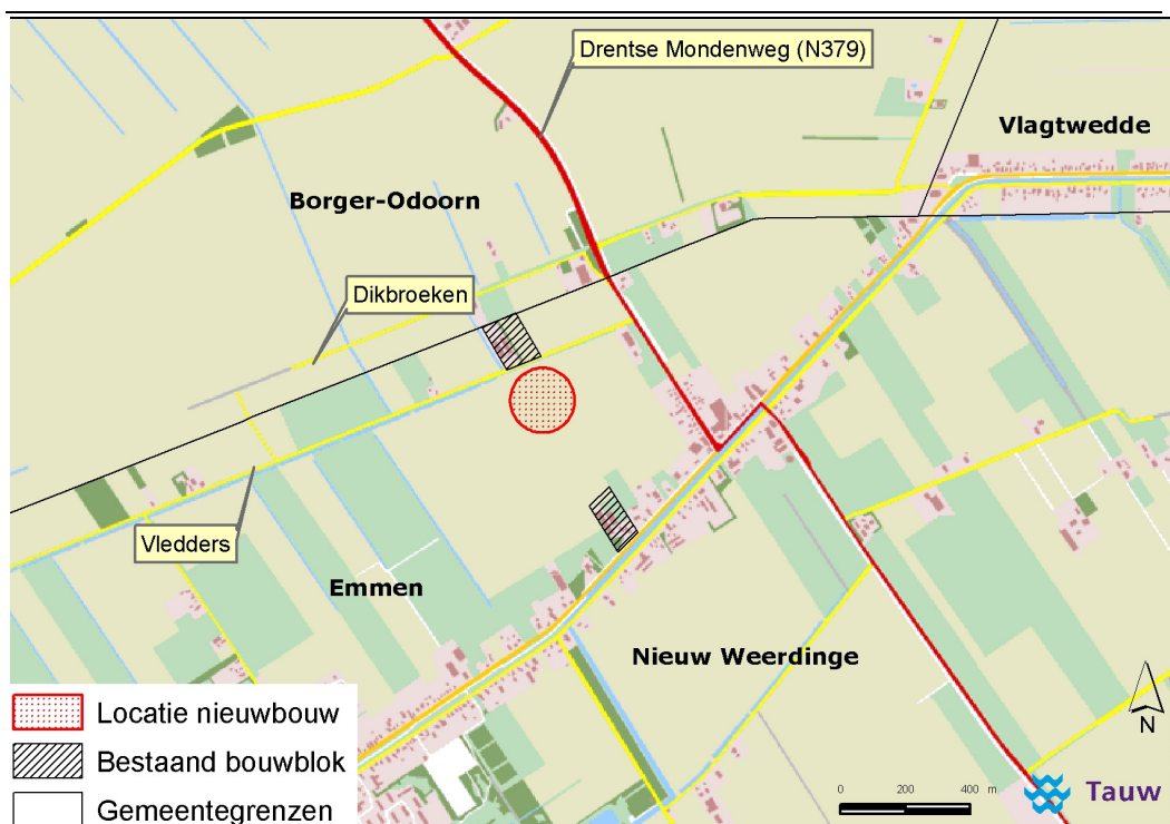
Figuur 2.1 Locatieaanduidingen pluimveehouderij v.o.f. Haan in Nieuw Weerdinge, gemeente Emmen

De ligging van bestaande bouwblokken en de beoogde locatie van de drie nieuw te bouwen stallen is in de onderstaande figuur aangegeven.