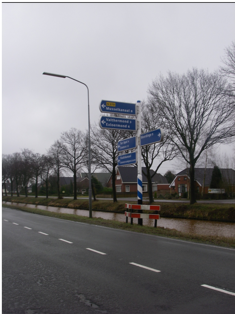
Figuur 1.2 Afslag uit Nieuw Weerdinge richting de Vledders

Deel B bevat de resultaten van de verschillende milieuonderzoeken. In deel C zijn alle bijlagen bij dit MER gebundeld.