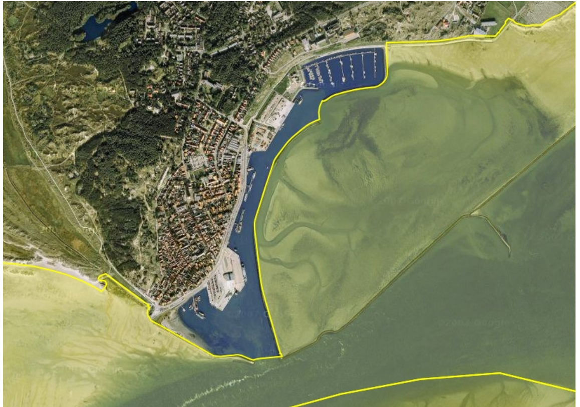
Figuur 4: Begrenzing Natura 2000-gebied Waddenzee rondom de haven van Terschelling