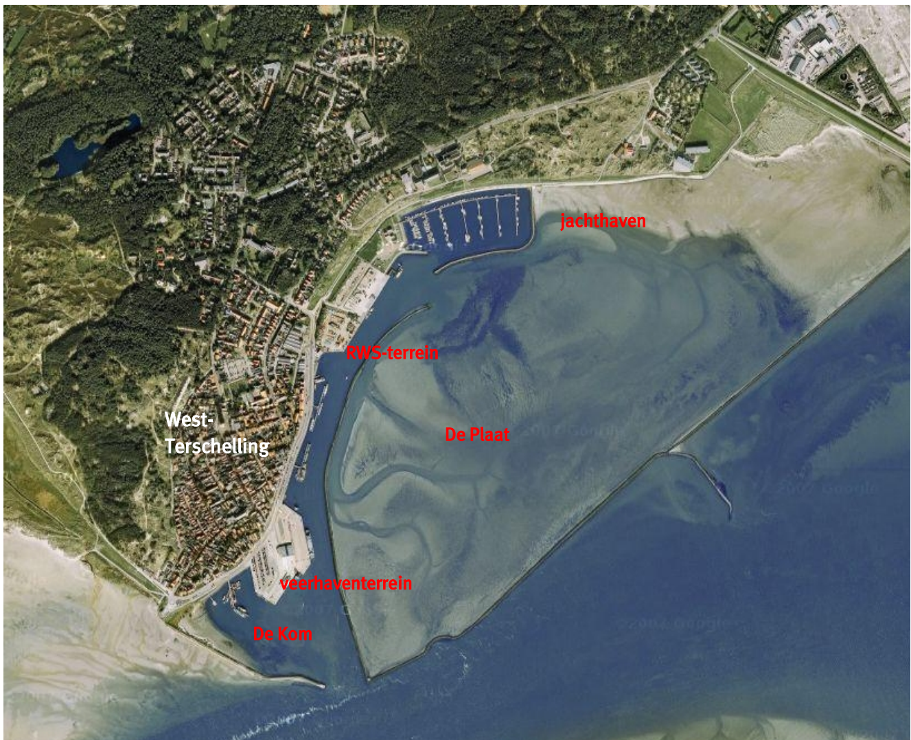
Figuur 1: Het plangebied

Voor u ligt de 'Startnotitie Milieueffectrapportage Herinrichting Havengebied Terschelling'. Deze notitie geeft het begin aan van de milieueffectrapportage (m.e.r.)-procedure 1 die wordt doorlopen ten behoeve van de besluitvorming over het bestemmingsplan voor de herinrichting van het havengebied bij West-Terschelling (figuur 1). Deze herinrichting is een initiatief van het College van burgemeester en wethouders van de gemeente Terschelling op basis van het Actieprogramma Structuurvisie Havengebied (gemeenteraad 22 oktober 2007) en het Inrichtingsplan Havengebied Terschelling (gemeenteraad 23 juni 2009).