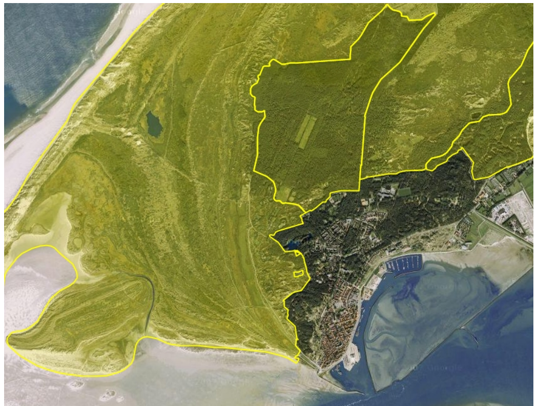
Figuur 5: Begrenzing Natura 2000-gebied Duinen Terschelling (Bron: minlnv.nl , Gebiedendatabase)