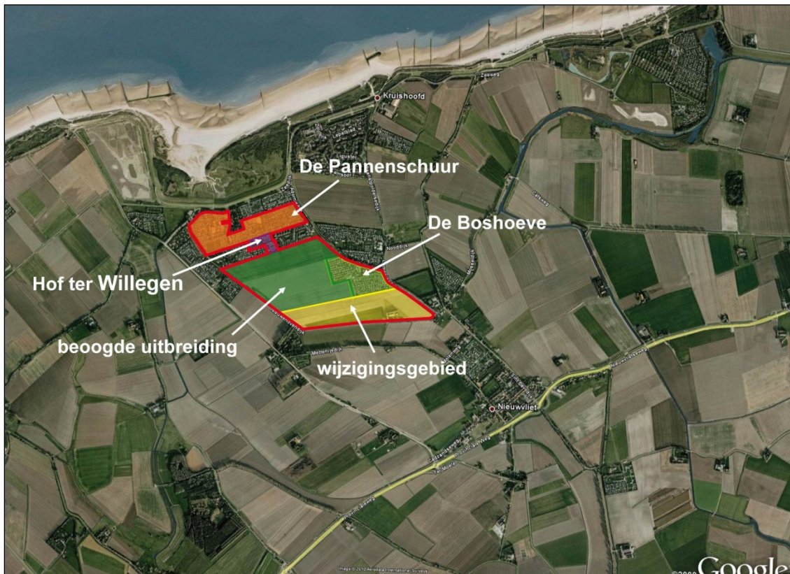
Figuur 1.1. Ligging plangebied (geel omlijnd), de betrokken campings (rood, blauw en groen) met de beoogde uitbreiding (donker groen) en het wijzigingsgebied (oranje)