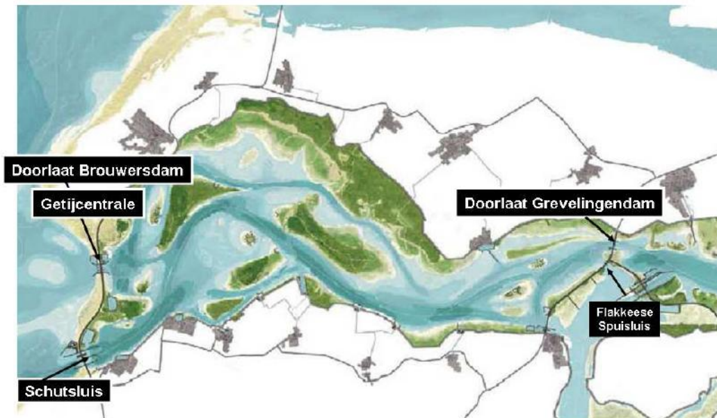
Figuur 2.2 MIRT Grevelingen

Voor de m.e.r.-(beoordelings)plichtige activiteiten wordt reeds een aparte planMER opgesteld. Daarbij wordt ook een passende beoordeling opgesteld.