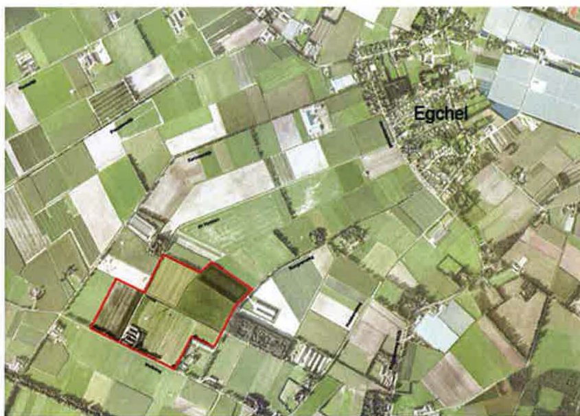
Kaart: Landbouwontwikkelingsgebied (LOG) Egchelse Heide

De gemeenteraad van Peel en Maas heeft het besluit genomen om een Landbouw Ontwikkelings Gebied (hierna LOG) te realiseren in de buurt van het dorp Egchel. Het LOG Egchelse heide is door de Structuurvisie Intensieve Veehouderij en Glastuinbouw buitengebied gemeente Peel en Maas nader begrensd (het gebied dat gelegen is binnen de rode lijn op onderstaande kaart). Het gebied is gelegen aan de Melkweg en de Rongvenweg. Het LOG biedt ruimte aan maximaal zes intensieve veehouderijen. Bedrijven die zich in het LOG vestigen moeten op een andere locatie een knelpunt oplossen in de gemeente Peel en Maas en dienen op de huidige locatie geen of onvoldoende ontwikkelingsmogelijkheden te hebben. De ontwikkelingen met betrekking tot de intensieve veehouderij in het LOG Egchelse Heide moeten worden geplaatst in een integrale gebiedsontwikkeling. In dit kader wordt er naar gestreefd het LOG te ontwikkelen als een zogenaamd "agropark": een totaalcomplex van bestaande en nieuwe veehouderijen met een goede landschappelijke inpassing, een goede verkeerskundige ontsluiting en mogelijkheden voor samenwerking op het gebied van energie en mestverwerking. Een dergelijk park is uitsluitend realiseerbaar op basis van een integraal ontwerp en maatschappelijk draagvlak. Het bestemmingplan LOG Egchelse Heide maakt rechtstreeks gebruiksruimte mogelijk voor twee intensieve veehouderijen. De vier overige veehouderijen worden indirect mogelijk gemaakt via een wijzigingsbevoegdheid.