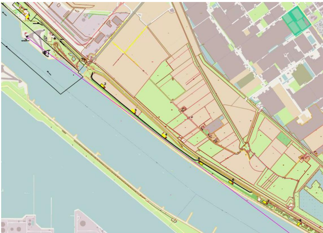
Afbeelding 1 Locaties windturbines (gele genummerde locaties)

Omdat de alternatieven niet onderscheidend zijn, is de berekening van de te verwachten slachtofferaantallen alleen aan het voorkeursalternatief uitgevoerd. Het geplande windpark Nieuwe Waterweg bestaat in het voorkeursalternatief uit 8 grotere turbines. Deze turbines hebben een rotordiameter van 112 meter en een ashoogte van 119 meter (tiphoogte 175 meter). De plaatsing van de turbines is terug te vinden in Afbeelding 1. Er worden geen windturbines in de bomenrij geplaatst, maar direct ten noorden hiervan. Alleen bij windturbine 7 (de tweede vanuit het oosten gezien) zullen enkele bomen worden gekapt. De doorgaande bomenrij blijft hierbij wel intact.