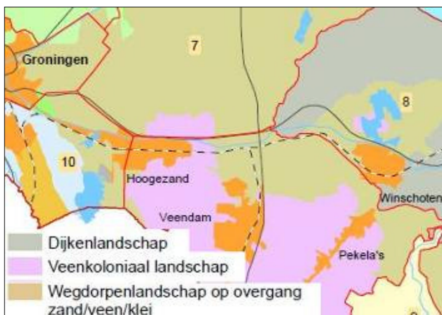
Figuur 2. Fragment kaart landschapstypen en deelgebieden, figuur 1-2 POP, 2009-2013, onderdeel landschap

De provincie heeft in het POP verschillende deelgebieden en bijbehorende landschapstypen aangewezen. Menterwolde ligt hoofdzakelijk in de deelgebieden 7 (Midden-Groningen) en 3 (Veenkoloniën). Onderstaande figuur geeft een fragment.