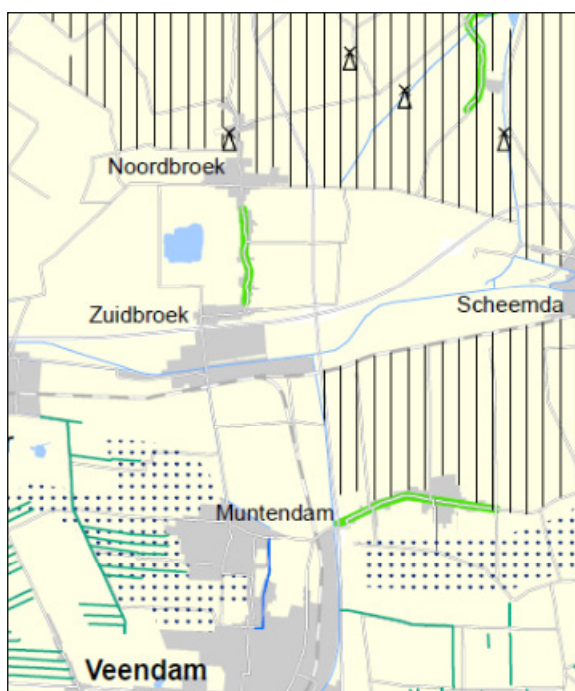
Figuur 3. Fragment kaart 6A Omgevingsverordening Groningen

De kaart met landschapswaarden wordt bij vaststelling van de herziening van de verordening in hoofdzaak intact gelaten. De 'groene linten' en de kenmerkende waterlopen in het veenkoloniale landschap zijn aangevuld.