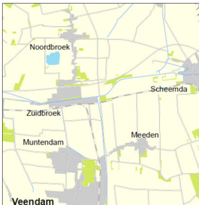
Figuur 4. Natuurgebieden in de gemeente Menterwolde.

In de gemeente Menterwolde komen enkele verspreid liggende natuurgebieden voor, zoals dorpsbosjes, verspreide natuurterreinen en de polder de Wieden. Deze gebieden maken evenwel geen onderdeel uit van de Ecologische Hoofdstructuur. Zie hiervoor ook onderstaande figuur.