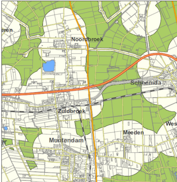
Figuur 5. Fragment gebiedskaart provincie Groningen (bron: Partiële herziening Omgevingsverordening, 2011)