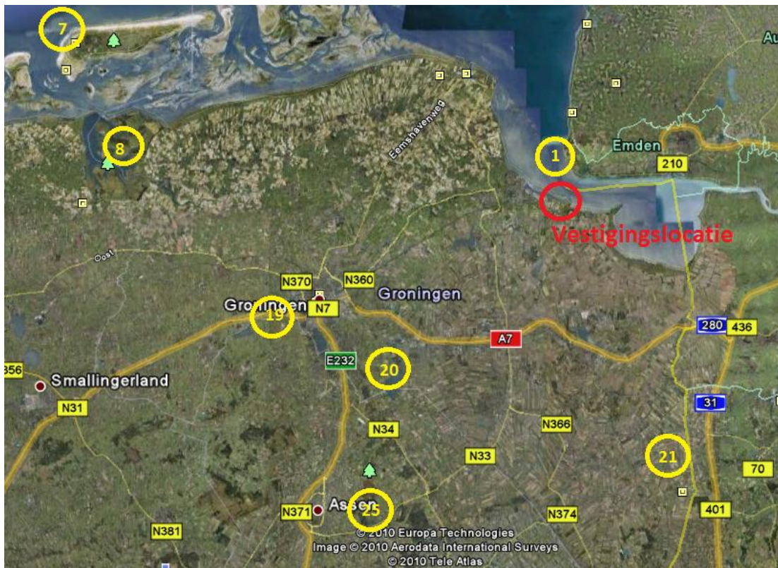
De Natura 2000 gebieden

Weergave van de vestigingslocatie en alle naburige Natura 2000 gebieden (bron nummering: ministerie ELI)