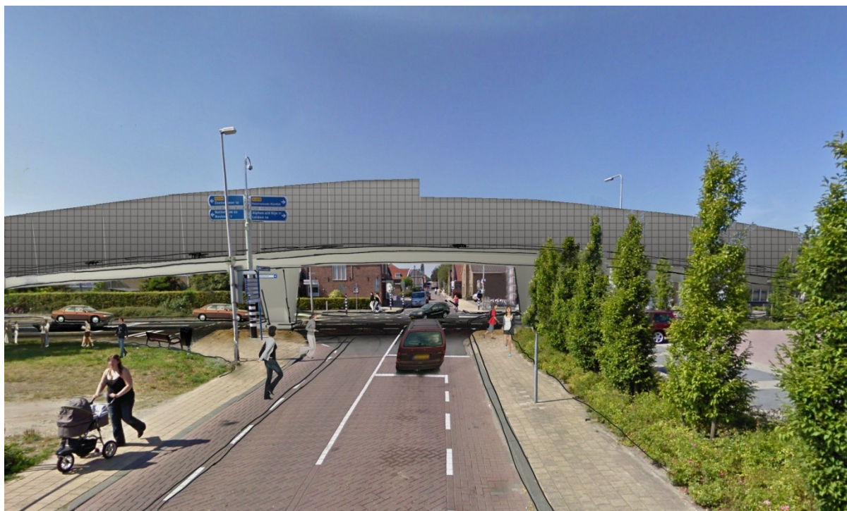
Figuur 3: Impressie / visualisatie viaduct met geluidsschermen

Langs de N209 inclusief het viaduct moeten geluidsschermen worden aangebracht om de geluidshinder te beperken.