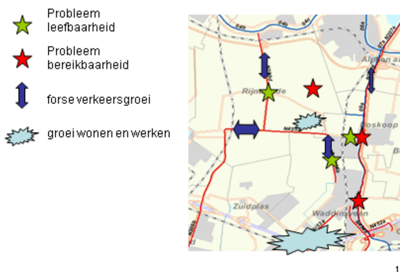
Figuur 1: situatie van locaties met problemen t.a.v. leefbaarheid en bereikbaarheid en ontwikkellocaties.

De doorstroming van het verkeer op de N207 en de N209 (vanaf Bleiswijk/Kruisweg) vormt een knelpunt. Opgemerkt wordt daarbij dat de regionale hoofdverbinding N207 aan de oostzijde van de Gouwe ligt, terwijl de kernen en het zwaartepunt van de Greenport Boskoop aan de westzijde liggen. Dit geeft een zware belasting op de oost-west verbindingen die via de twee hefbruggen de Gouwe kruisen.