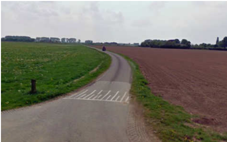
Figuur 8: Capellegoedweg (oost)

De Capellegoedweg (oost) kent een beperkte breedte van de rijbaan. Deze weg, die in de nieuwe hoofdontsluitingsroute is gelegen, zal door initiatiefnemer worden verbreed om tegemoetkomend verkeer beter te kunnen passeren.