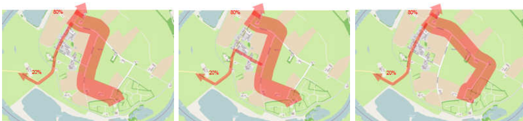
Figuur 7: Routes en verdeling verkeer van/naar Dorado Beach (plansituatie: links route B1 en rechts route B2 naar verplaatste ingang, onder route A met huidige ingang)

Naast de plansituatie met verplaatste in-/uitgang is ook een plansituatie doorgerekend met behoud van de huidige in-/uitgang (in figuur 7 rechts, route A).