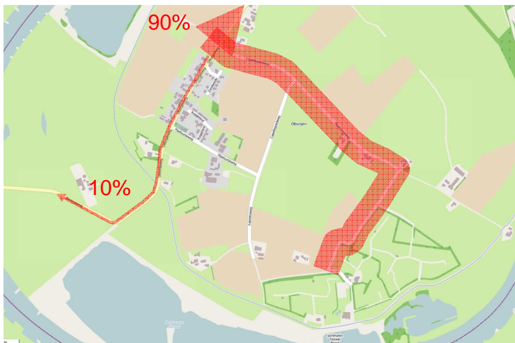
Figuur 4: Routes en verdeling verkeer van/naar Dorado Beach (huidige situatie)

Een tabel met de intensiteiten per wegvak in 2014 is opgenomen in bijlage 1. In totaal zijn er negen wegvakken waarvoor de verkeersintensiteit (en de wijzigingen hierin ten gevolge van de plannen) berekend worden. Deze wegvakken worden in figuur 5 weergegeven. Op vier van de negen wegvakken hebben verkeersstellingen plaatsgevonden. Ook deze zijn in figuur 5 opgenomen. Op basis van de verkeersproductieberekeningen en de gemeten intensiteiten op deze vier locaties zijn de ook voor de overige vijf wegvakken de intensiteiten becijferd. In de tabel in figuur 6 wordt per wegvak beschreven op welke wijze dit gebeurd is, voor zowel de huidige als de toekomstige indeling van het wegennet.