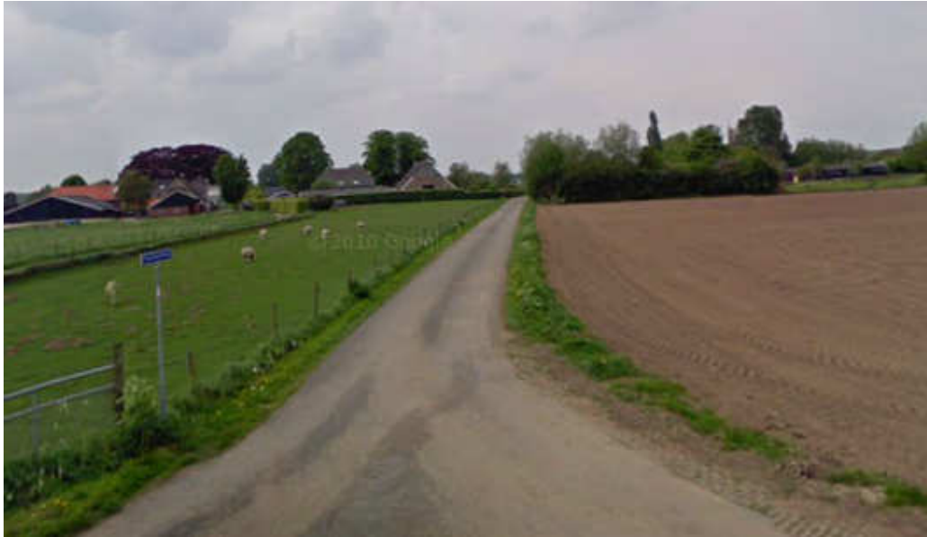
Figuur 9: Capellegoedweg (zuid)