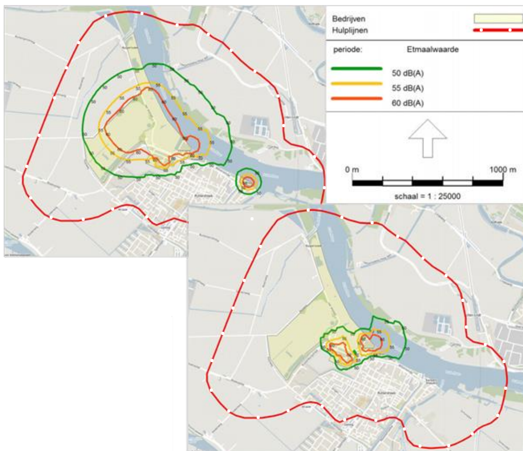
Figuur 2: geluidcontouren voor het voornemen (boven) en in de huidige feitelijke situatie (onder). 10 De hulplijn is telkens de 50 dB(A)-contour van de vigerende geluidzone. Deze figuur is afgeleid uit figuren 3 en 4 in bijlage 7 van het MER.

De Commissie constateert dat door uit te gaan van een geluidproductie van 68 dB(A)/m 2 voor het gehele terrein de effecten van een ruime invulling van het bedrijventerrein zijn berekend 11 waardoor niet bij alle woningen aan de etmaalgrenswaarde van 50 dB(A) wordt voldaan. 12 Hierdoor moeten voor een aantal woningen hogere grenswaarden worden vastgesteld. 13