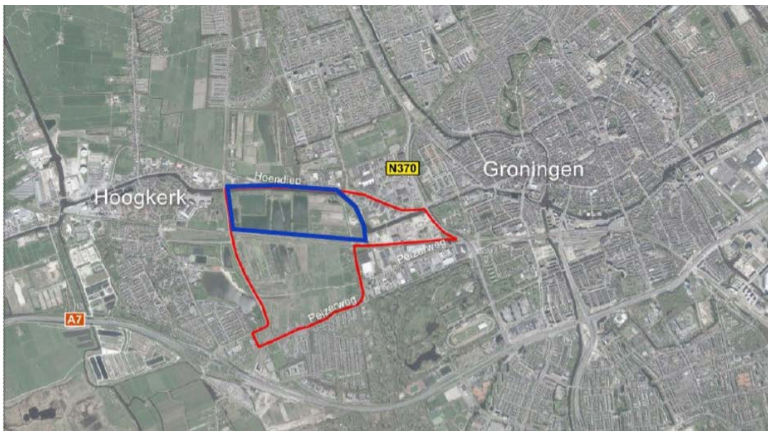
Figuur 1 Overzichtskaart met in rood het plangebied van de structuurvisie, en in blauw het bestemmingsplan Deelgebied Noord