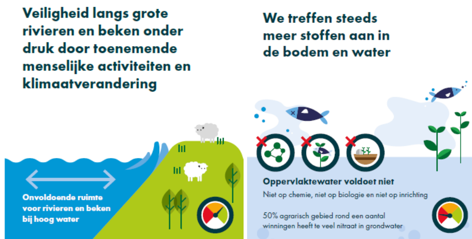
Figuur 3 Beoordeling van de huidige toestand van waterveiligheid (links) en waterkwaliteit (rechts) (bron: aanvulling)

De Commissie beveelt aan om in de titels van figuren en de tekst scherper onderscheid te maken tussen de relatieve mate waarin een alternatief bijdraagt aan het behalen van de doelen tegenover de absolute doelstellingen voor de 5 thema's. Voorkom daarmee het dubbel gebruik van de term doelbereik.