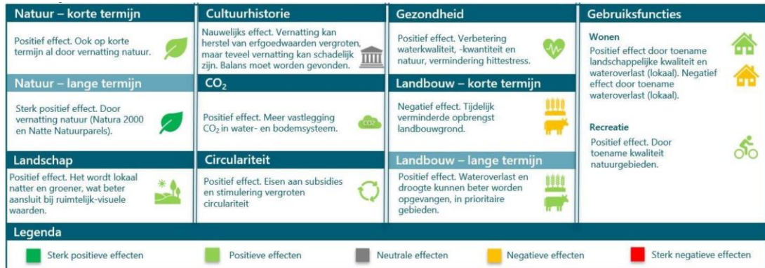
Figuur 1 Milieueffecten van het voorkeursalternatief (bron: aanvulling)

In hoofdstuk 2 licht de Commissie haar beoordeling toe en geeft ze aandachtspunten voor het vervolgtraject.