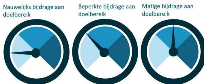
Figuur 2 Gebruik van het woord 'doelbereik' in afbeelding 7.1 van de aanvulling waar het gaat om de mate waarin wordt bijgedragen aan het bereiken van het doel.