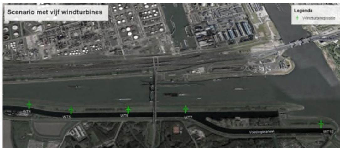
Figuur 1: Voorkeursalternatief Windpark Brielse Maasdijk, in groen de turbineposities, in het midden is de Hartelburg zichtbaar.

Tot slot vraagt de Commissie nog aandacht voor haar eerdere aanbeveling over het landschappelijk compensatieplan. 3