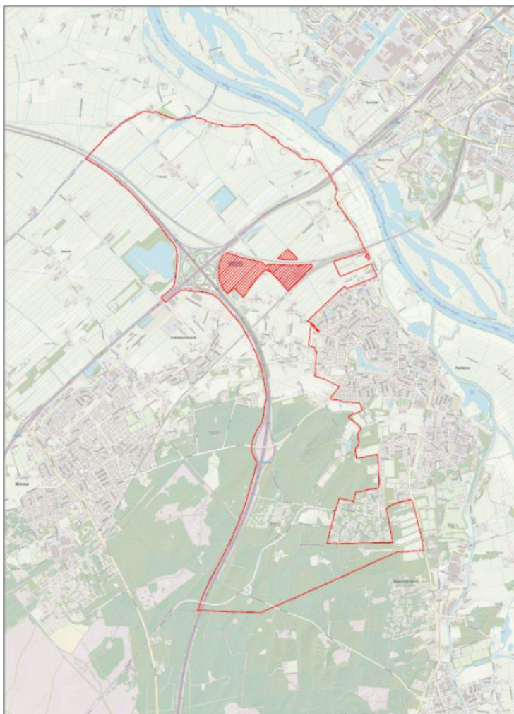
Figuur 1 Plangebied Chw-bestemmingsplan Buitengebied Hattem. De gearceerde delen maken geen deel uit van het plangebied

In hoofdstuk 2 licht de Commissie haar beoordeling toe en geeft ze aandachtspunten voor het vervolgtraject.