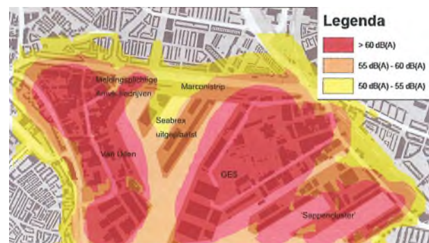
Deel van een contourenkaart uit een milieueffectrapport

In het milieueffectrapport moet terug te vinden zijn op basis waarvan conclusies zijn getrokken. Formules en uitgebreide tabellen met alle basiscijfers kunnen beter (voor de liefhebber) in een bijlage worden opgenomen.