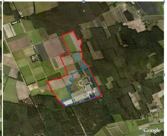
Alternatief Noordwaarts (rode lijn) blauwe lijn huidige begrenzing Toverland Afbeelding 2