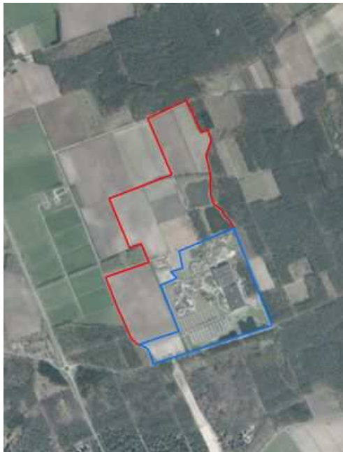
Voorkeursvariant (rode en blauwe lijn) blauwe lijn huidige begrenzing Toverland Afbeelding 3