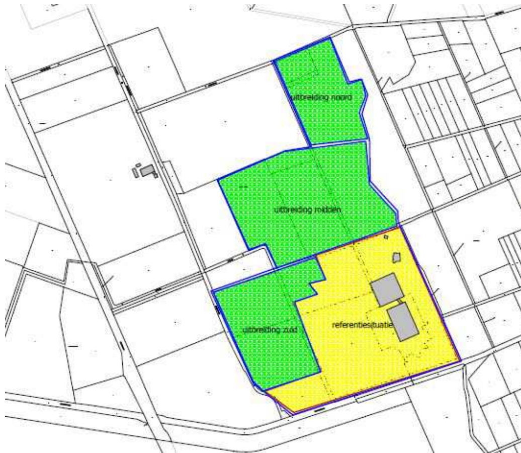
Afbeelding 6: Uitbreiding (groene gebied) en referentiesituatie (gele gebied) (bron: Aanvullend akoestisch onderzoek, Industrielawaai Agel Adviseurs)