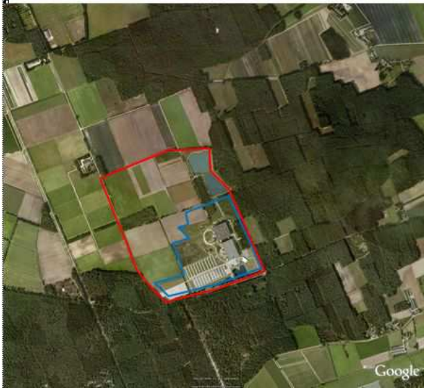
Alternatief Westwaarts (rode lijn) blauwe lijn huidige begrenzing Toverland Afbeelding 1