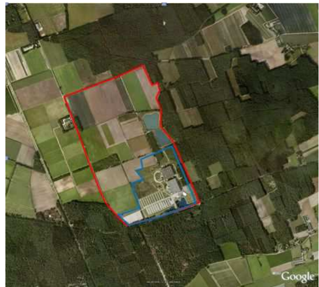
Lange termijn (rode lijn) blauwe lijn huidige begrenzing Toverland Afbeelding 4