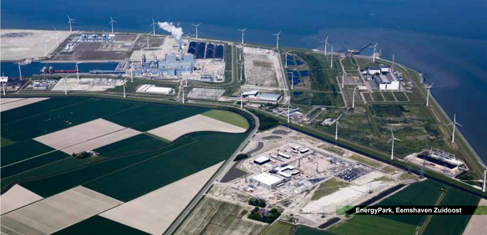
EnergyPark, Eemshaven Zuidoost