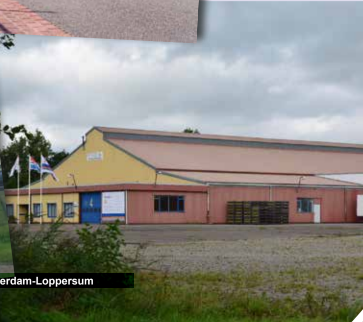
Seendweg-Delfzijl, Edama-Uithuizen, Boerdam-Loppersum