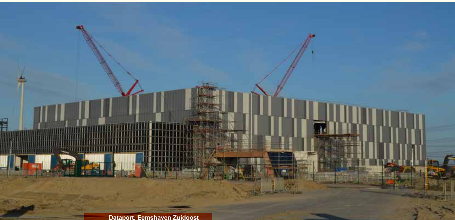
Dataport, Eemshaven Zuidoost

Na de vestiging van Google Datahotel (circa 43 hectare) in september 2014 wordt een verdere door groei in de vestiging van datahotels voorzien. (Bureau Buiten, 2015). Het gebied Eemshaven Zuidoost wordt fasegewijs ontwikkeld om tot 2035 in de vraag naar terreinen voor datahotels te kunnen voorzien (bijlage 2). De eerste fase van bedrijventerrein Zuidoost is inmiddels planologisch bestemd voor datacenters. Vervolgfase 2 wordt bestemd indien zich een concrete vraag naar vestiging van datahotels aandient en behoort daarmee tot de strategische voorraad voor grote incidentele uitgaven. Vanwege de buitendijkse ligging is vestiging in de Eemshaven zelf niet aan de orde. Daarmee zijn datahotels geen concurrentie voor andere vestigers in de Eemshaven.