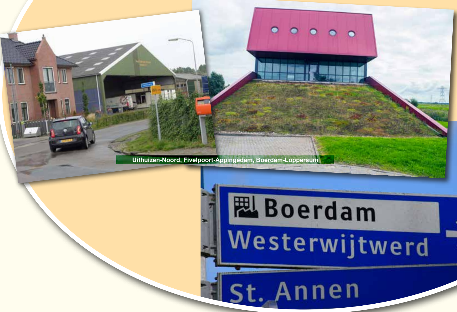
Uithuizen-Noord, Fivelpoort-Appingedam, Boerdam-Loppersum