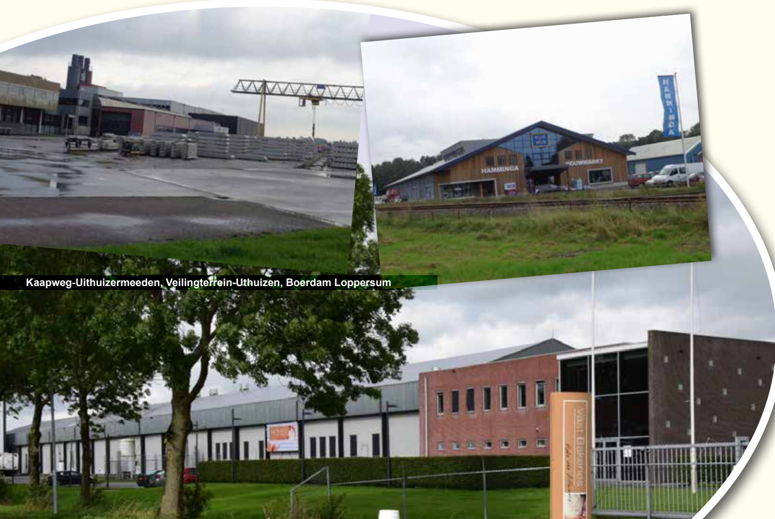
Kaapweg-Uithuizermeeden, Veilingterrein-Uithuizen, Boerdam Loppersum

“Centrum Veilig Wonen brengt expertise, ervaring in en kennis op het gebied van veiligheid, schade-intake en afhandeling, bouwkunde en procesmanagement en beheersing samen. Ook in samenwerking met kennisinstellingen als Hogescholen en de Rijksuniversiteit Groningen. Zo zal er in de provincie Groningen een open en toegankelijk kennis- en technologiecentrum ontstaan dat een centrale plaats wil innemen in Nederland op het gebied van aardbevingsbestendig bouwen en alle aspecten die daarmee samenhangen.” (citaat uit businessplan CVW, 2015) (bijlage 4)