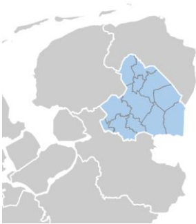
Afbeelding 3.1 Provincie Drenthe

De Omgevingsvisie Drenthe heeft betrekking op het hele grondgebied van de provincie Drenthe. Binnen de provincie liggen twaalf gemeentes. De provincie Drenthe grenst in het noorden aan de provincie Groningen, in het oosten aan de Duitse deelstaat Nedersaksen (landkreisen Emsland en Grafschaft Bentheim), in het zuiden aan de provincie Overijssel en in het westen aan de provincie Friesland.