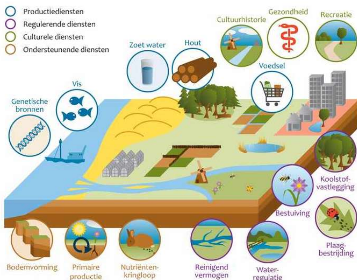
Figuur 1. Het belang van natuur.

De inbreng van natuur in de Omgevingsvisie is in de eerste plaats het onderkennen van het belang van natuur -samen met een gezonde bodem, water en lucht- voor de Friese samenleving. Dit vormt de bron van ons natuurlijk kapitaal; Dit reguleert , produceert en levert bodemvruchtbaarheid, plaagonderdrukking, bestuiving , waterberging en het vastleggen van CO2. Daarmee levert het een bijdrage aan een gezonde, veilige en aangename leefomgeving. Natuur, bodem en water dragen bij aan een rijke, beleefbare, identificeerbare leefomgeving. Het levert een, vitale en dynamische leefomgeving en daarmee een aantrekkelijk woon-, werk- en recreatiemilieu. Het bindt mensen aan Fryslân en trekt bedrijven aan. Los van de betekenis voor andere functies vormt de verscheidenheid aan leefvormen (biodiversiteit) ook een waarde in zichzelf. Daarmee vormt natuur een van de pijlers voor het Friese Omgevingsbeleid.