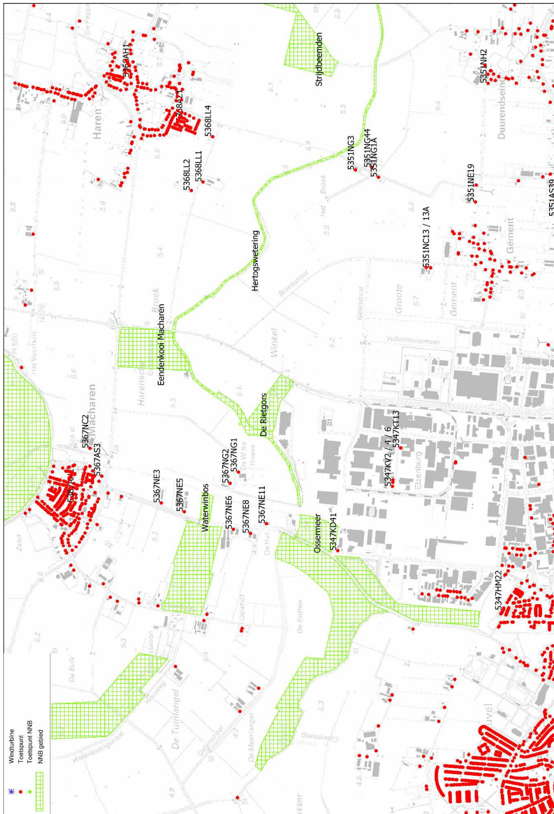
figuur 2 ligging van de ontvangerpunten