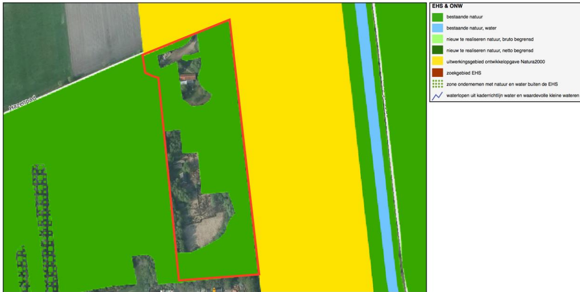
Figuur 2: Ligging in de EHS

Deels zijn ontwikkeling gepland op gronden aangewezen als EHS. De ligging van de locatie in de EHS is hierna weergegeven. Daarna zijn de nieuwe ontwikkelingen in relatie tot de EHS weergegeven.