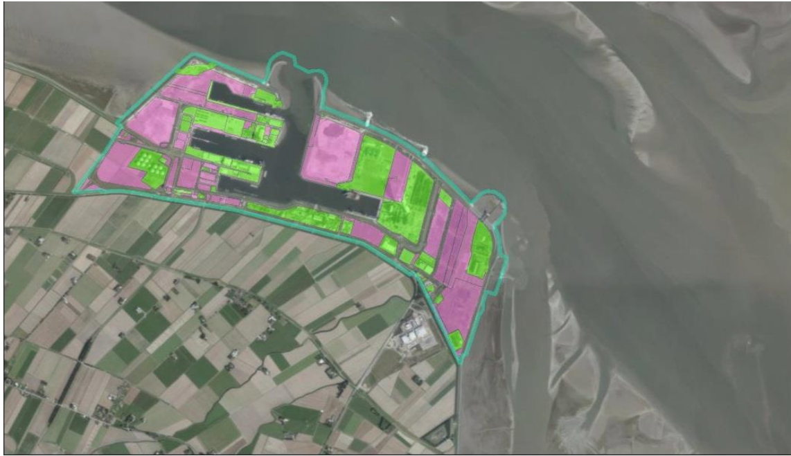
Afbeelding 1.1 Terreinen in de Eemshaven die behoren tot de referentiesituatie (groen) en de plansituatie (roze)