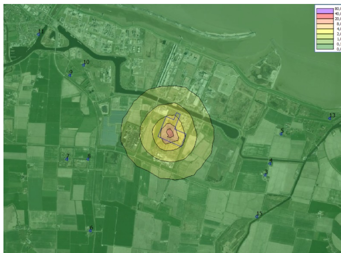
Figuur 6.4 Geurbelasting in ouE/m^3 van het 99,5-percentiel. In de figuur zijn de toetspunten weergegeven (verblijfsobjecten) en de inrichtingsgrens