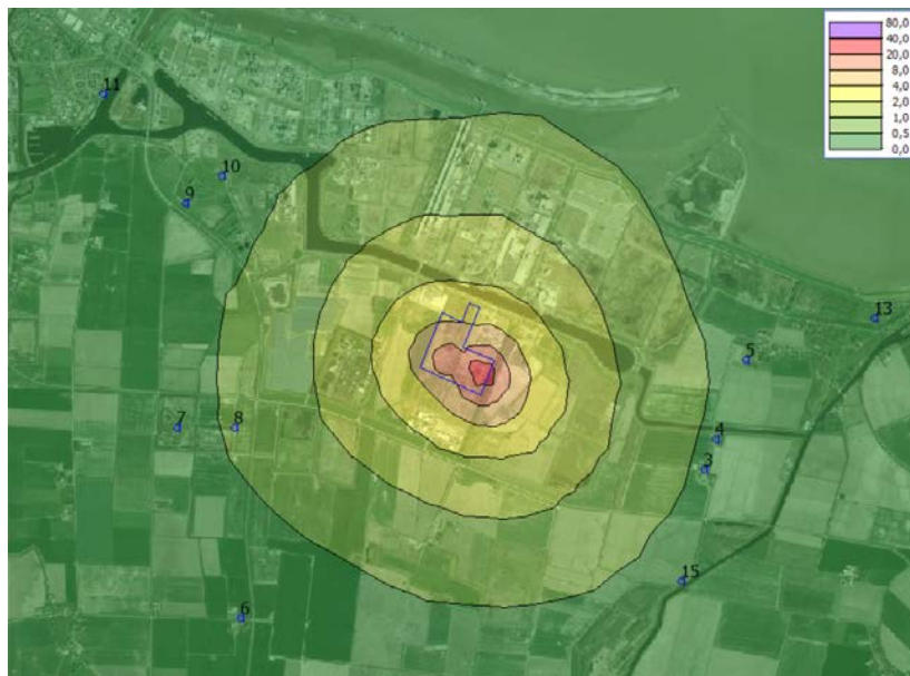
Figuur 6.2 Geurbelasting in ouE/m^3 van het 99,5-percentiel. In de figuur zijn de toetspunten weergegeven (verblijfsobjecten) en de inrichtingsgrens