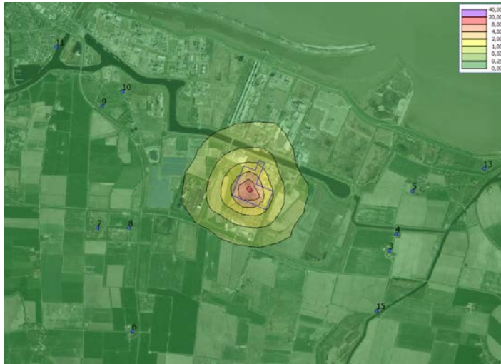
Figuur 6.5 Geurbelasting in ouE/m 3 van het 98-percentiel. In de figuur zijn de toetspunten weergegeven (verblijfsobjecten) en de inrichtingsgrens

Variante 4 , het gebruik van de stikstofleiding in het industriegebied, in plaats van aanvoer per truck, heeft geen effect op de geurbelasting in de omgeving.