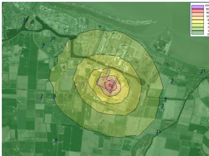
Figuur 6.3 Geurbelasting in ou_e/m^3 van het 99,9-percentiel. In de figuur zijn de toetspunten weergegeven (verblijfsobjecten) en de inrichtingsgrens