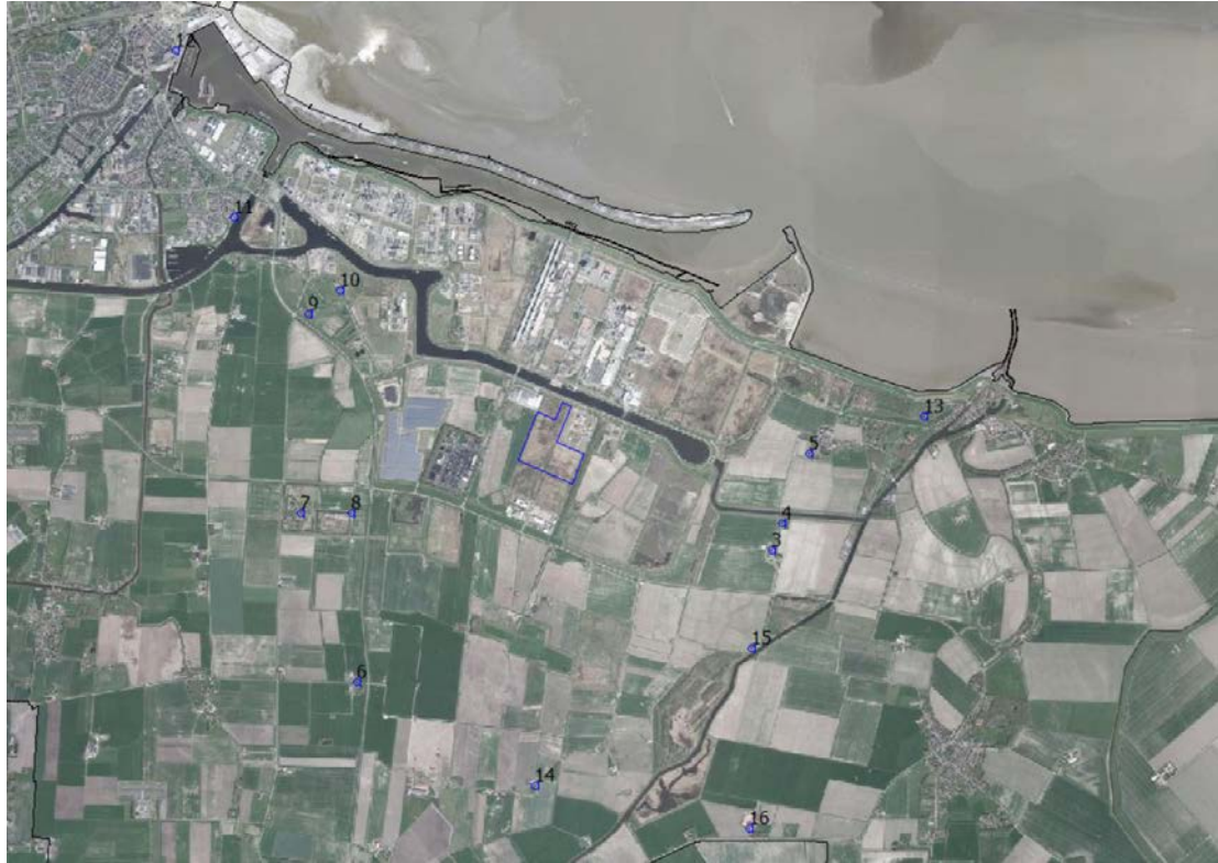
Figuur 5.1 Beoordelingslocaties