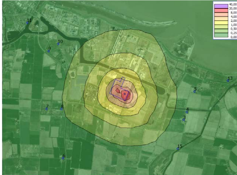
Figuur 6.1 Geurbelasting in ouE/m^3 van het 98-percentiel. In de figuur zijn de toetspunten weergegeven (verblijfsobjecten) en de inrichtingsgrens