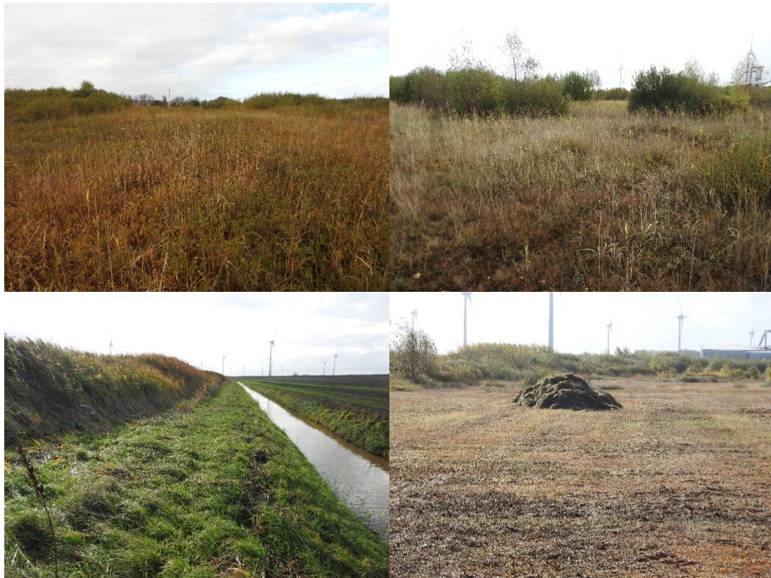
Figuur 2.2 Impressie van het plangebied

De vegetatie is gevarieerd en structuurrijk, er is een afwisseling van delen begroeid met mos, lage grassen, zeggen en russen, kleine vrijstaande struikjes, wilgenstruweel en riet. In dit deel van het plangebied is slechts één boom aanwezig, een forse wilg. Tijdens het veldbezoek was een klein deel van het plangebied recent gemaaid, op basis van de historische luchtfoto's blijkt dat het plangebied in de loop der jaren meermaals is gemaaid. Dit gebeurde vrijwel altijd in delen waarbij er ook overjarige vegetatie bleef staan. Het huidige wilgenstruweel is op zijn hoogst circa 4 tot 5 meter en vermoedelijk niet ouder dan drie jaar. Het rietland in het zuidoosten is vrij dicht en zo'n twee meter hoog, daardoor was dit deel niet inspecteerbaar tijdens het veldbezoek.