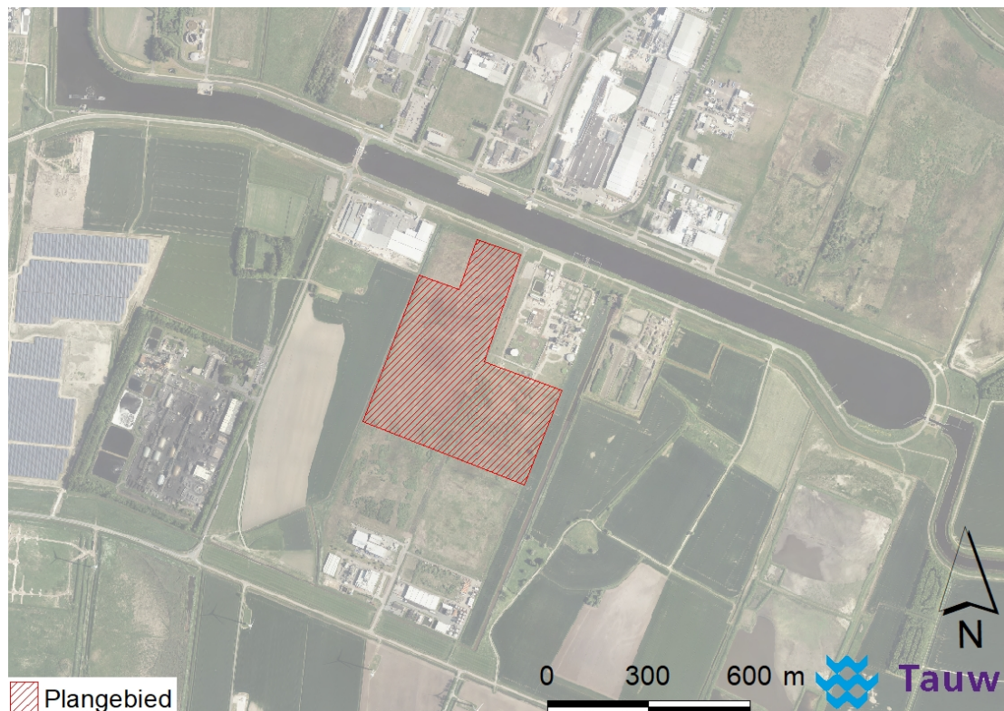
Figuur 2.1 Ligging van het plangebied

Het plangebied is gelegen aan de rand van het industrieterrein Oosterhorn in Delfzijl en ten oosten van Farmsum (zie figuur 2.1). Het plangebied wordt aan de oostzijde omsloten door een smalle strook agrarisch grasland en aan de westzijde door een smalle, vrij ondiepe watergang. Het merendeel van het plangebied is rond 1980 opgehoogd tijdens de aanleg van het Oosterhornkanaal ten noorden van het plangebied. Dit deel ligt zo'n anderhalve meter hoger dan de rest van het plangebied. Een impressie van het plangebied is weergegeven in figuur 2.2.