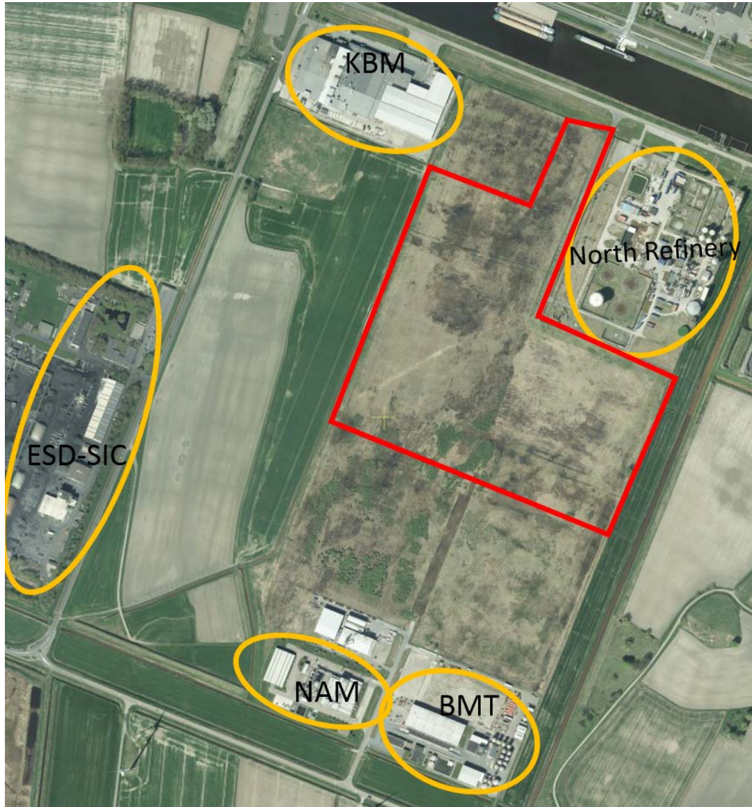
Figuur 2.2 Ruimtelijke ligging omliggende locaties