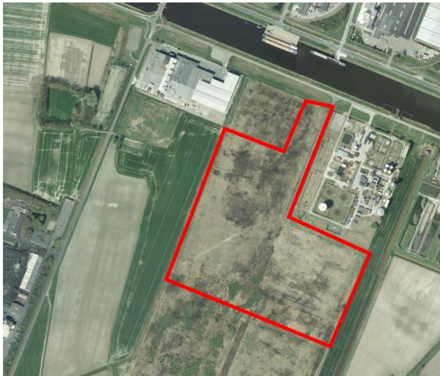
Figuur 1.1 Locatie Verda

Op basis van de resultaten van het vooronderzoek wordt advies gegeven in hoeverre aanvullend verkennend bodemonderzoek nodig is voor het vaststellen van de milieuhygiënische nulsituatie. De grenzen van de onderzoekslocatie zijn weergegeven in figuur 1.1.