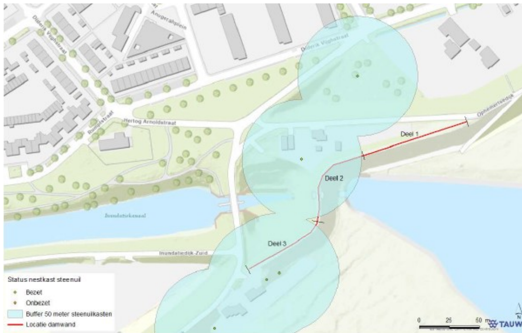
Figuur 4.1, fasering werkzaamheden rondom de steenuikasten

Deel 1: uitvoering in mei tot en met juli