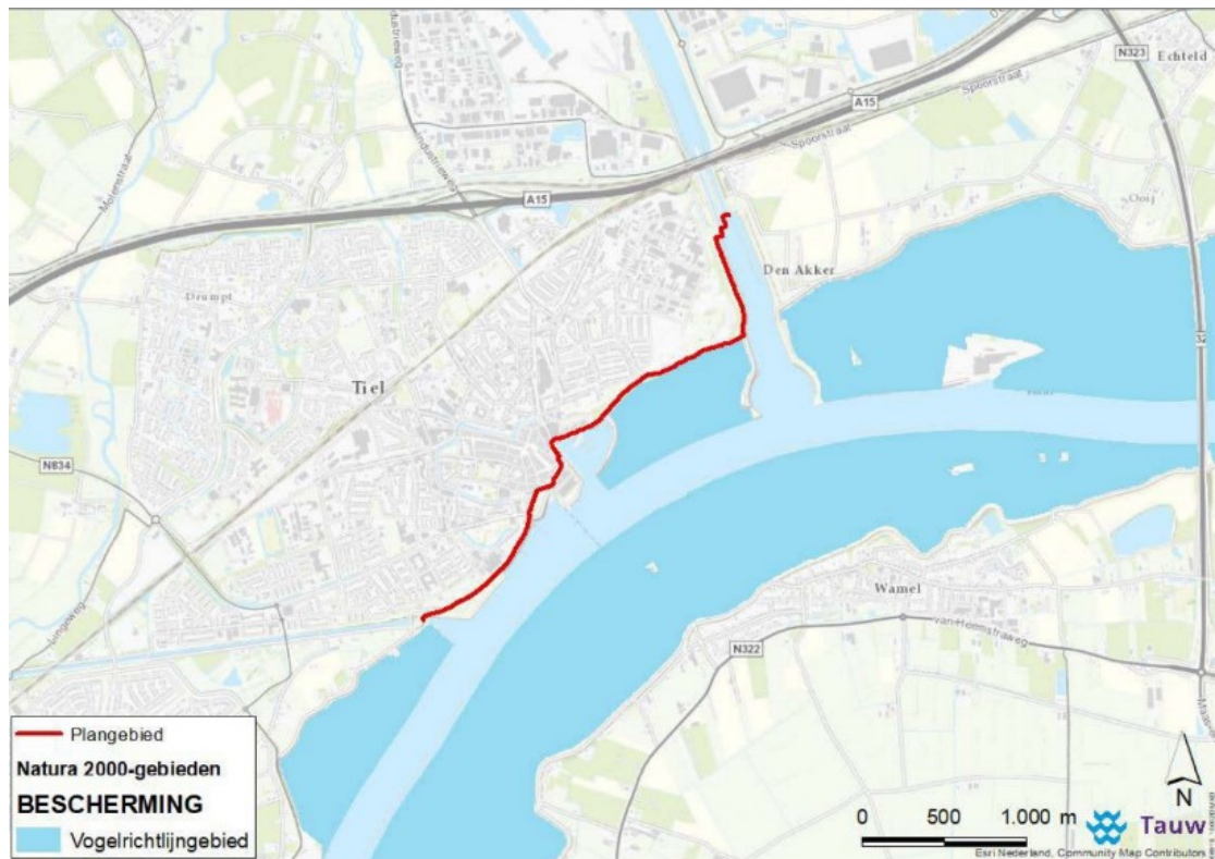
Figuur 2 Ligging dijkversterkingstraject Stad Tiel t.o.v. het Natura 2000-gebied Rijntakken.