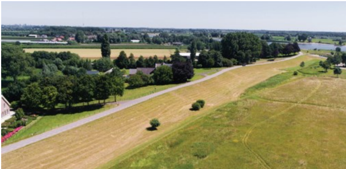
Figuur 4 Dijk als klare lijn

Het doel van het dijkontwerp is een compact en eenduidig dijkprofiel. Met uitzondering van de nieuwe steunberm ten noordoosten van het Veerhuis en de kleine taludverflauwing aan de binnen- en buitenzijde, om de oorspronkelijke taludhelling te herstellen naar een talud van 1:3, wordt de dijkversterking volledig gerealiseerd binnen het huidige dijkprofiel. Als uitgangspunt voor het dijkverbeteringsontwerp geldt een toelaatbaar overslagdebiet van 5 l/m/s, zodat de dijk niet verhoogd hoeft te worden om aan de veiligheidseisen te voldoen. Hierdoor is het mogelijk om de versterkingsmaatregelen met zo min mogelijk ruimtebeslag te realiseren en het oorspronkelijke landschap zoveel mogelijk in tact te laten. De smalle kruin en relatief steile taluds die kenmerkend zijn voor Salmsteke blijven zichtbaar. De steunbermen die wél worden aangelegd worden in één vloeiende lijn aangehecht aan de bestaande steunberm tussen dijkpaal 91 en 95. De bestaande steunberm verandert op deze manier van een kleiner, op zichzelf staand element, naar een onderdeel in het grotere verhaal van de dijk. Hierin is een helder onderscheid tussen de vierkante, compacte dijk op zand, en een aaneengesloten steunberm op klei. Het principe van de klare lijn moet ook in acht genomen worden bij de verkeerskundige inrichting van de dijk.