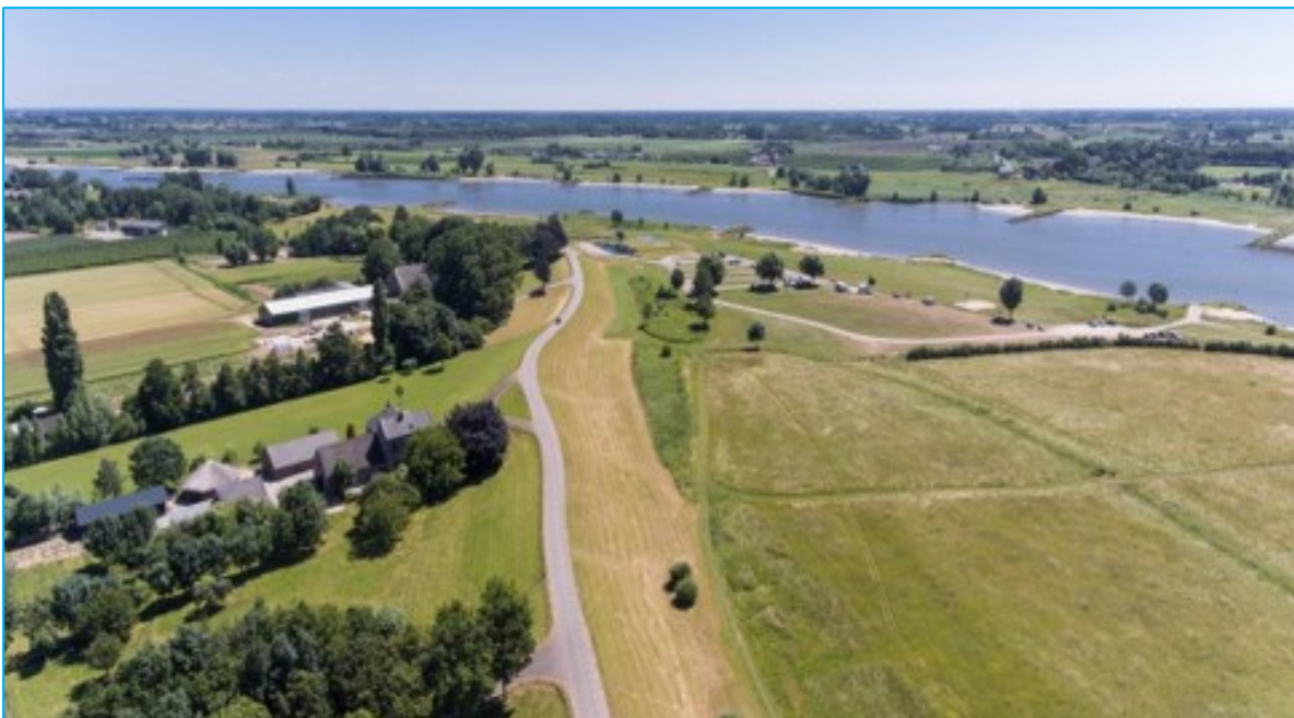
Figuur 2 Impressie van het plangebied in de huidige situatie

Langs de dijk liggen in totaal negen clusters van gebouwen. Hiervan hebben er drie een monumentale status: het Oude Veerhuis (Lekdijk Oost 9), boerderij Zorgwijk (Lekdijk Oost 5) en de August's Hoeve (Lekdijk Oost 4). Het Oude Veerhuis maakt samen met het oude waterschapshuis en het peilhuisje (beiden buiten het plangebied) onderdeel uit van een historisch ensemble langs de dijk. De monumenten zijn beeldbepalend voor het traject Salmsteke. De aansluitingen naar de dijk zijn beplant met bijzondere bomenrijen van populier, kers, appel of beuk, sommige hiervan vormen statige oprijlanen. In het binnendijkse cultuurlandschap liggen verder hagen, rijen bomen, kleine struwelen en lopen fruitboomgaarden en tuinen door tot op de dijk.