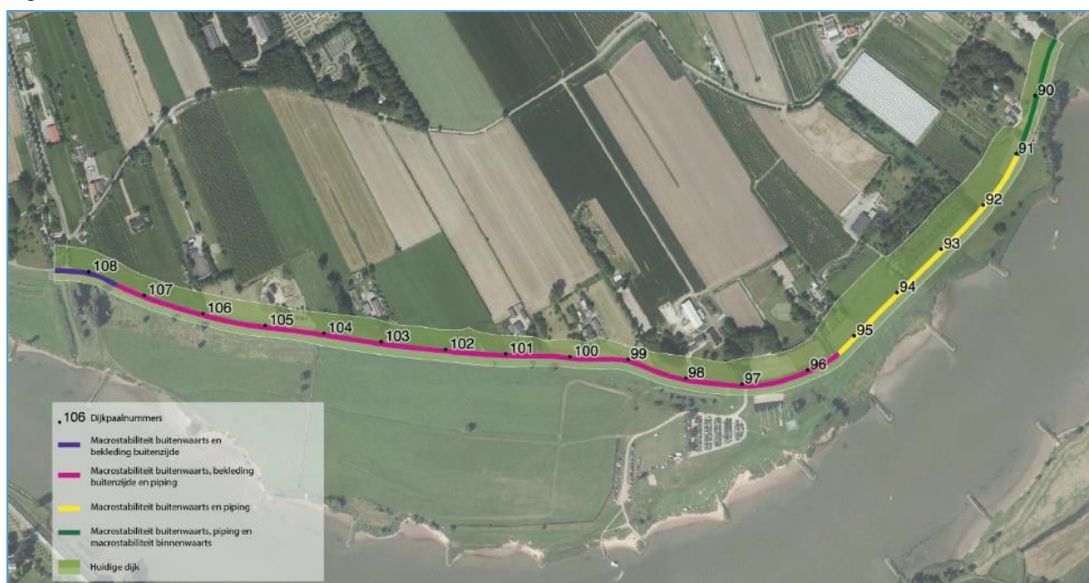
Figuur 3 Kaart Waterveiligheidsopgave Dijkversterking Salmsteke

De dijk binnen het traject Salmsteke dient versterkt te worden omdat deze niet voldoet aan de veiligheidsnorm ten aanzien van de faalmechanismen piping, macrostabiliteit en bekleding buitenwaarts. Het dijktraject is op basis van de geotechnische gesteldheid (bodempopbouw en ondergrond) en de geometrie van het dijklichaam opgedeeld in vier dijkvakken. In figuur 3 is de ligging van deze dijkvakken, inclusief de maatregelen die getroffen worden langs het dijktraject, afgebeeld.