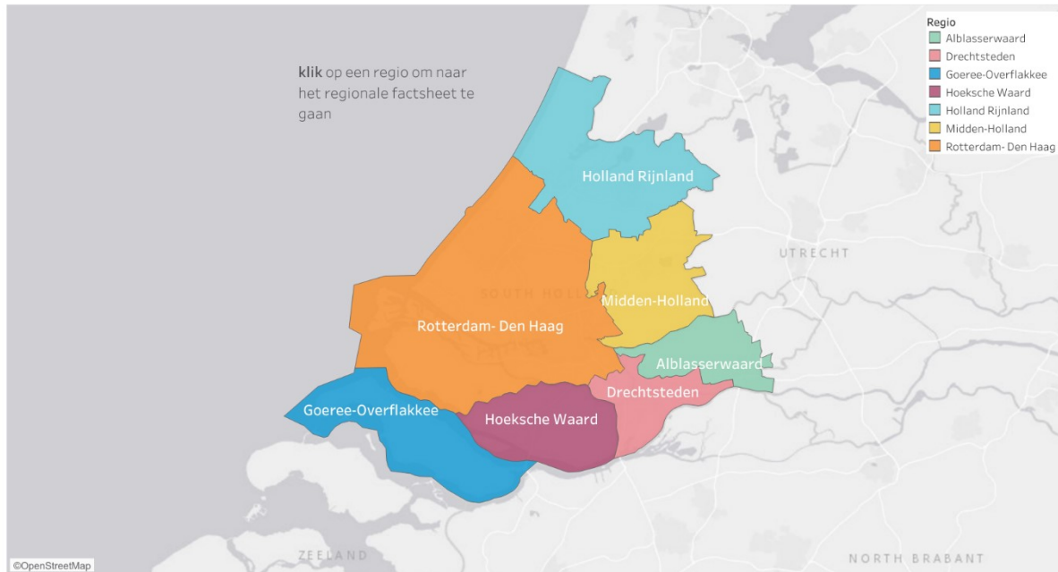
Afbeelding 1: RES (regionale energiestrategie) regio's Zuid-Holland

RES (regionale energiestrategie) regio's Zuid-Holland