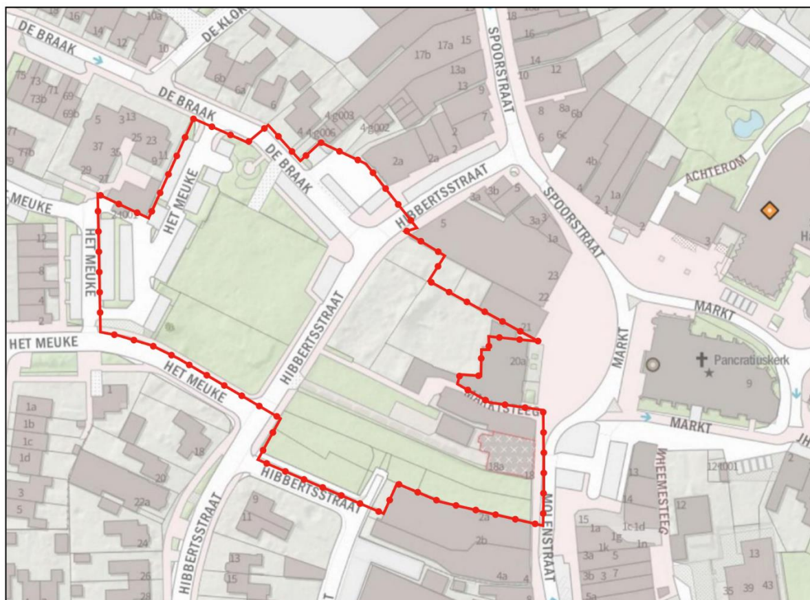
Afbeelding 2.3 Ligging van het projectgebied

Afvalstoffen worden zoveel mogelijk gescheiden om nuttige afvalstoffen op eenvoudige wijze te kunnen inzamelen en vervolgens te verwerken/recyclen. Er is geen sprake van de productie van gevaarlijk afval. De afvalstoffen zullen conform de daarvoor van toepassing zijnde reglementen worden afgevoerd.