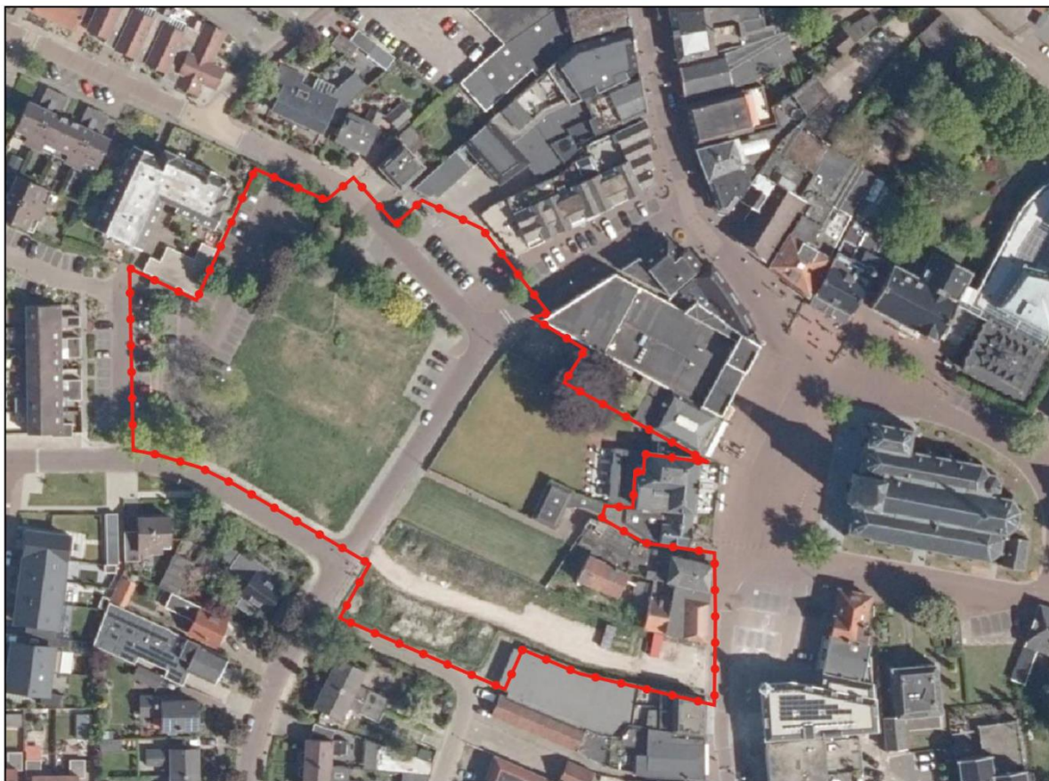
Afbeelding 2.1 Luchtfoto van het projectgebied