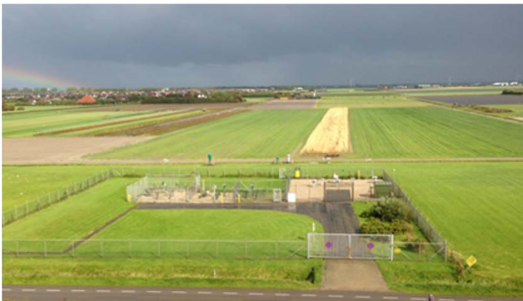
Figuur 4-1: Voorbeeld van een afsluiterlocatie

Afsluiterlocaties zijn kleinschalige installaties voor de aanvoer van waterstof naar de leiding en afvoer van waterstof uit de leiding. Met behulp van afsluiters kunnen leidingsecties worden afgesloten om waterstoftransport te onderbreken, zodat er veilig onderhoud kan plaatsvinden aan leidingonderdelen. Afsluiterlocaties zijn ook nodig om het systeem te kunnen uitbreiden en nieuwe klanten te kunnen aansluiten zonder dat hierbij het gehele systeem uit bedrijf moet. Een afsluiterlocatie is bovengronds toegankelijk en bedienbaar. De afsluiters zelf bevinden zich in de leiding onder de grond. De locatie is afgescheiden van de omgeving middels een hekwerk. De oppervlakte van een afsluiterlocatie bedraagt naar verwachting enkele tientallen vierkante meters (zie figuur 4.1 voor een voorbeeld).