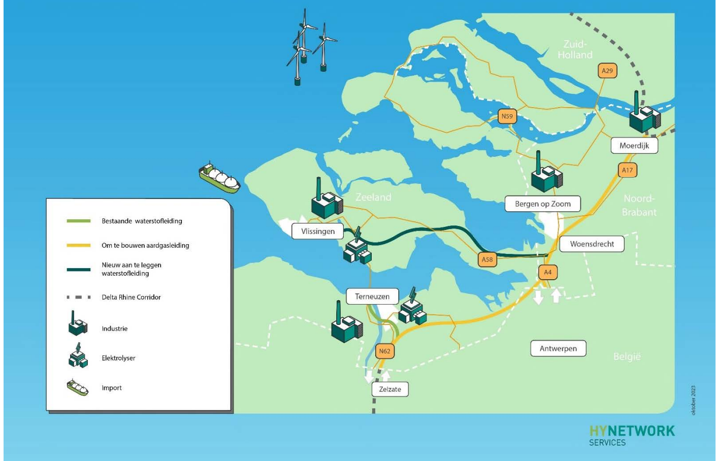
Figuur 1-1. Schematisch overzicht van het waterstofnetwerk Zuidwest-Nederland met bestaande en nieuwe leidingen