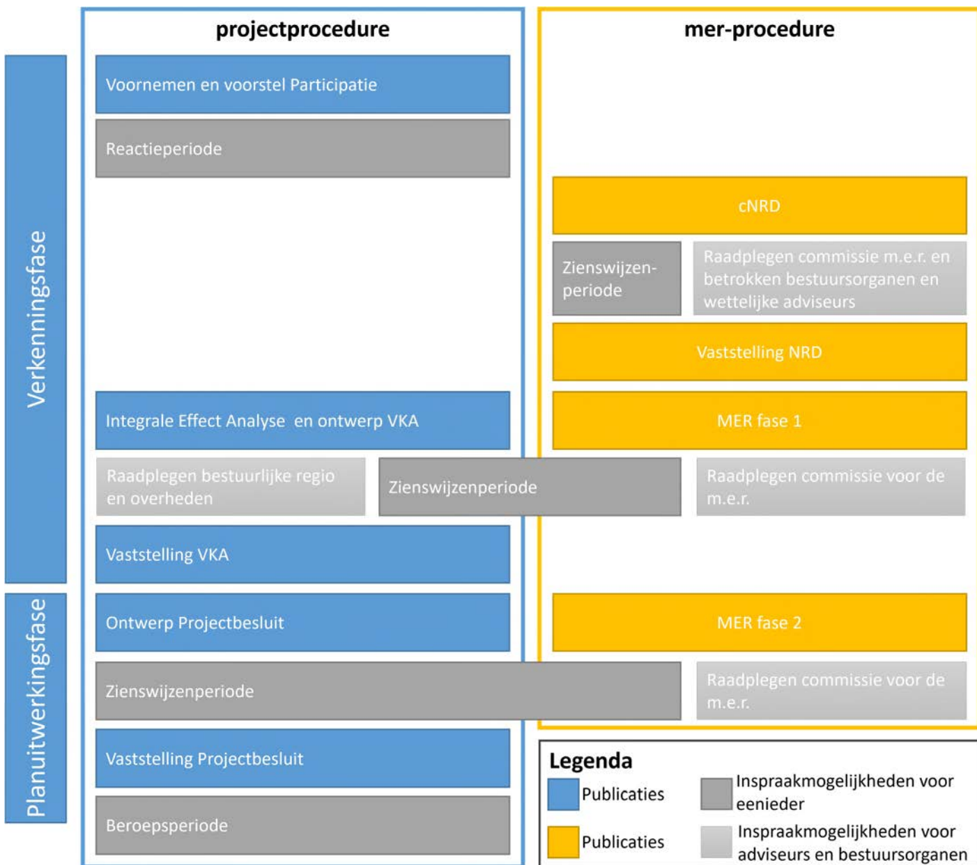
Figuur 2-1 Projectprocedure met de hieraan gekoppelde m.e.r.-procedure (de gekoppelde vergunningprocedures zijn niet opgenomen)

In figuur 2.1 zijn de gekoppelde project- en m.e.r.-procedures weergegeven met de stappen die worden doorlopen (chronologische weergave van boven naar beneden).