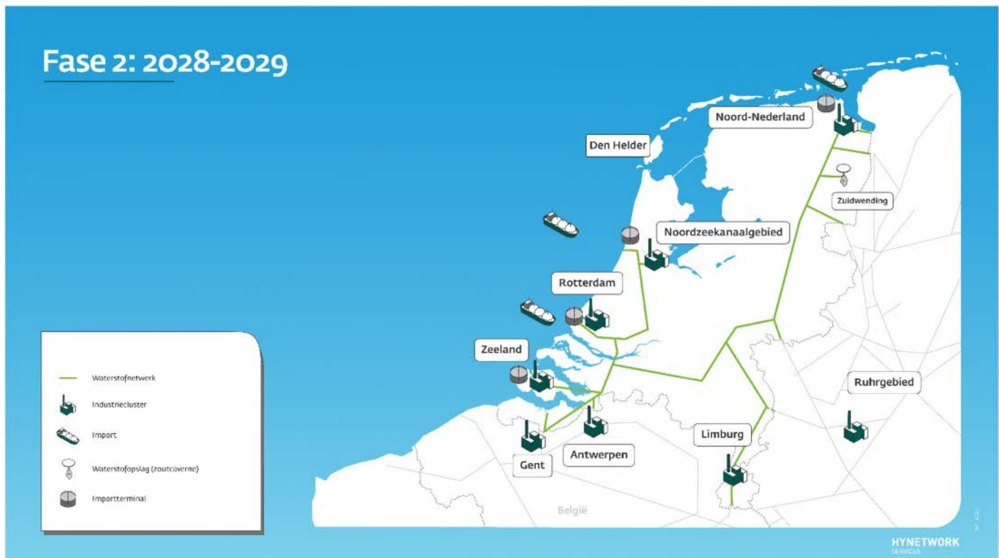
Figuur 3-3. Schematisch overzicht fase 2 Waterstofnetwerk Nederland (2028 - 2029) (conceptvoorstel aanpassing uitrolplan, HNS 3 juli 2023)