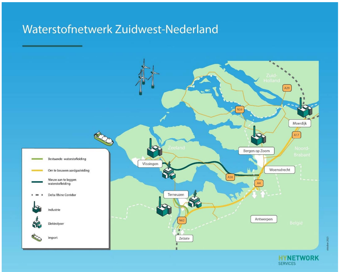
Figuur 3-4. Waterstofnetwerk Zuidwest-Nederland met bestaande en nieuwe leidingen

Een tijdig beschikbaar waterstofnetwerk is nationaal, maar ook regionaal, dus op het niveau van de Schelde Deltaregio Zeeland en West Brabant, essentieel voor de ontwikkeling van de waterstofeconomie. In de Schelde Deltaregio bevinden zich veel energie- en grondstof intensieve bedrijven, met een grote verduurzamingsopgave. De regio is ook op dit moment al een grote waterstofproducent en -gebruiker. Momenteel gaat het nog om productie en gebruik van grijze waterstof. De realisatie van een waterstofnetwerk helpt een duurzaam vestigingsklimaat te creëren. Hiermee behoudt de regio een goede positie op gebied van economische groei en werkgelegenheid.