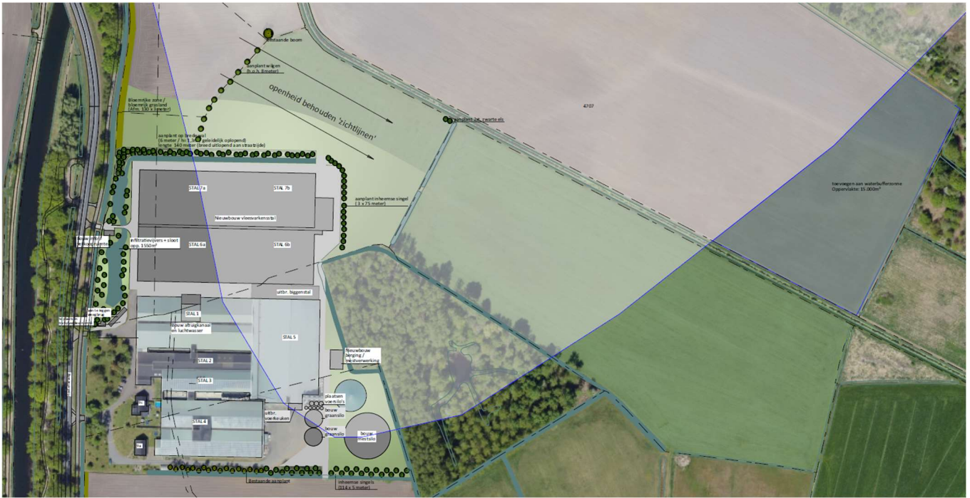
De bebouwing wordt deels gerealiseerd binnen het bestaande waterbergingsgebied (opgelicht), waarbij de compensatie hiervoor op het zuidoostelijke deel van perceel F 4707 (donkergrijs) plaatsvindt