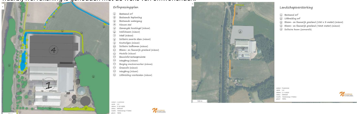
Links het erfinrichtingsplan/landschappelijk inpassingsplan, rechts de extra kwaliteitsinvesteringen/KGO-maatregelen landschapsversterking

Het huidige provinciale ruimtelijke beleid geeft geen eisen ten aanzien van de omvang van het bouwvlak. Wel moet er sprake zijn van uitbreiding van een bestaand agrarisch bedrijf en moet bij een grootschalige uitbreiding er sprake zijn van een grote plus voor ruimtelijke, duurzame en sociale kwaliteit. In de vooroverlegreactie d.d. 1 juni 2023 is de provincie ingegaan op deze aspecten. De gewenste extra kwaliteitsinvesteringen zijn grotendeels opgenomen in het op 1 september 2023 geactualiseerde landschappelijke inpassingsplan (bijlage 14 MER/bijlage 5 Ruimtelijke onderbouwing), waarbij wel rekening is gehouden met de wens van omwonenden.