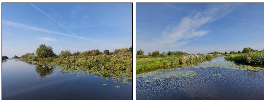
Figuur 2.6. Impressie van deelgebied X.

Deelgebied X bestaat uit 'Overige gebieden' bestaande uit het midden en oostelijke deel van de zuidplas, het gebied ten noorden van de Noordplas en Achterbos. Het bestaat uit jachthavens, caravan- en bungalowparken aan de noordzijde, de Zuidplas en het gebied ten zuidwesten van Achterbos. Achterbos is een uniek gebied met veen en water. Een stuk oud cultuurlandschap dat een indicatie geeft van het uiterlijk van de Vinkeveensepolder voordat de Vinkeveense plassen zijn ontstaan. In figuur 2.5 is een impressie gegeven van deelgebied X.