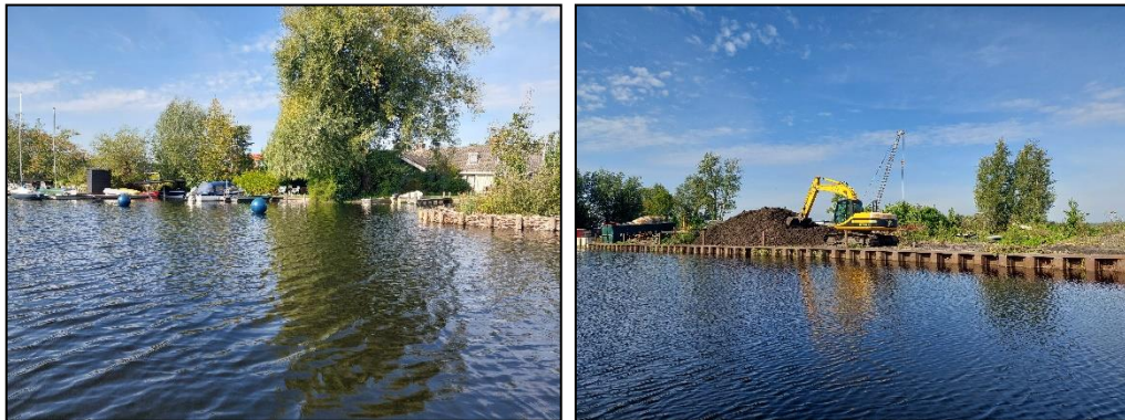
Figuur 2.2. Impressie van deelgebied A.

Dit deelgebied heeft als belangrijkste kenmerk dat het aangesloten is op het vaste land en ook over land bereikbaar is. Aan de Achterbos en Herenweg zijn veel parkeerplaatsen aanwezig, waar de eigenaren van de legakkers hun auto parkeren om vervolgens te voet verder te gaan. Al zijn er ook legakkers die met de auto bereikbaar zijn. Aan de westzijde zijn veel stacaravan aanwezig, naar het oosten betreft het meer diverse opstallen en vakantiewoningen. De inrichting bestaat voornamelijk uit schuttingen en strakke beplanting. De oeverbeschoeiing is veelal strak en intact. In figuur 2.2 is een impressie gegeven van deelgebied A