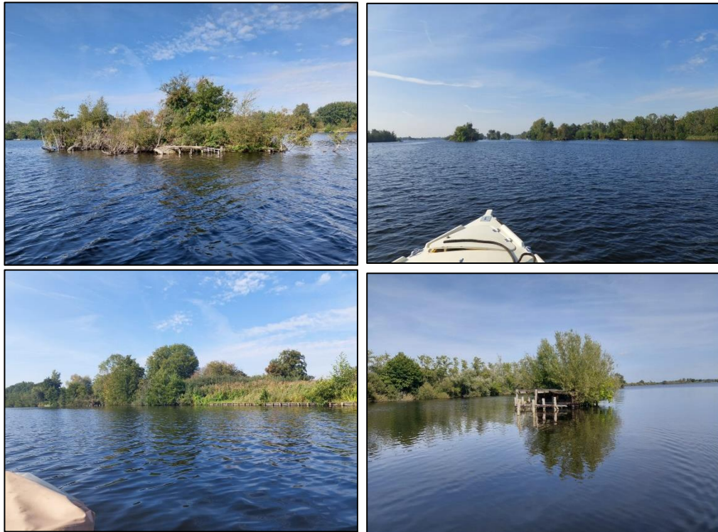
Figuur 2.3. Impressie van deelgebied B.