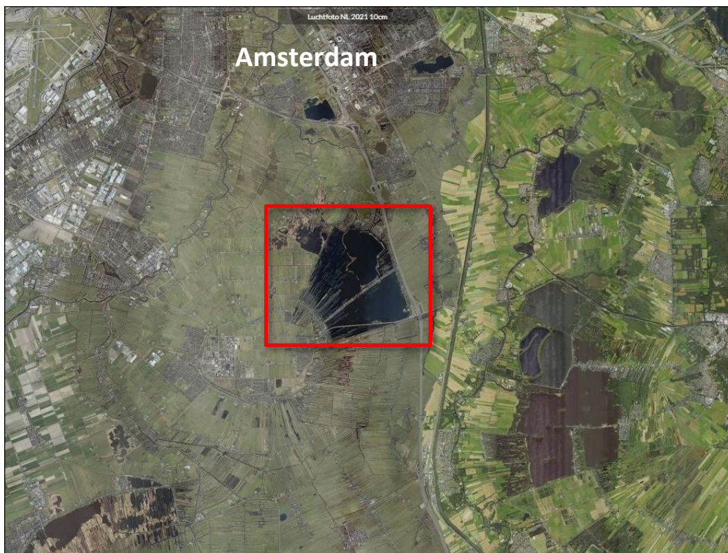
Figuur 1.1. Globale ligging van het plangebied (rood omkaderd) ten opzichte van de omgeving.

De toetsing aan Natura 2000 (Wnb-gebiedsbescherming) is in een passende beoordeling en separaat stikstofonderzoek uitgevoerd en voor de toetsing aan NNN is een natuurplan en rapport met de invulling NNN compensatie opgesteld. Deze onderwerpen komen daarom niet meer aan bod in de voorliggende natuurtoets.