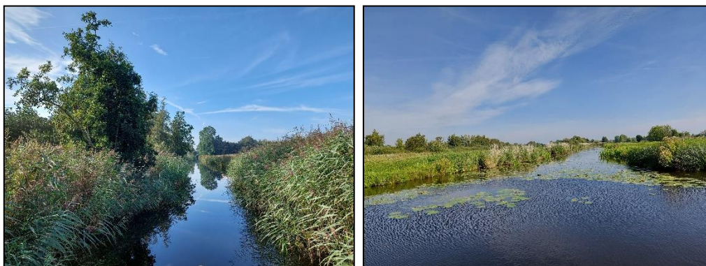
Figuur 2.4. Impressie van deelgebied C.

Dit deelgebied bestaat uit legakkers in of nabij kwetsbare zones zoals natuurgebieden. De meeste legakkers zijn niet verbonden met het land, zijn zeer smal en klein. De eilanden zijn deels bewoond ook worden er eilandjes gebruikt om te kamperen. Van alle legakkers hebben deze de meest natuurlijke uitstraling, met ruige opgaande begroeiing. In figuur 2.4 is een impressie gegeven van deelgebied C.