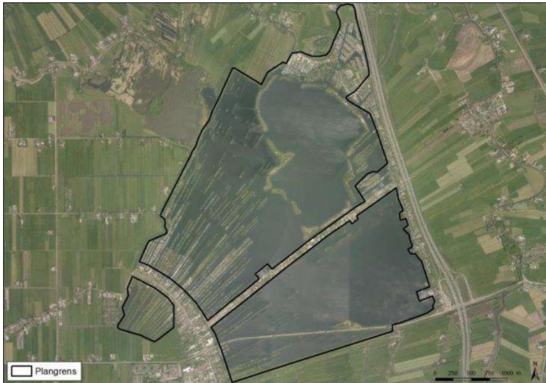
Figuur 1.2. Gedetailleerde ligging van het plangebied (zwart omkaderd).