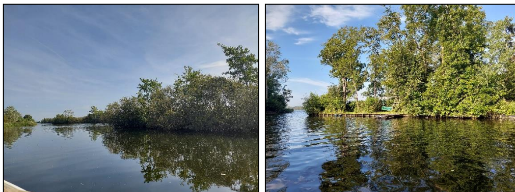
Figuur 2.5. Impressie van deelgebied D.