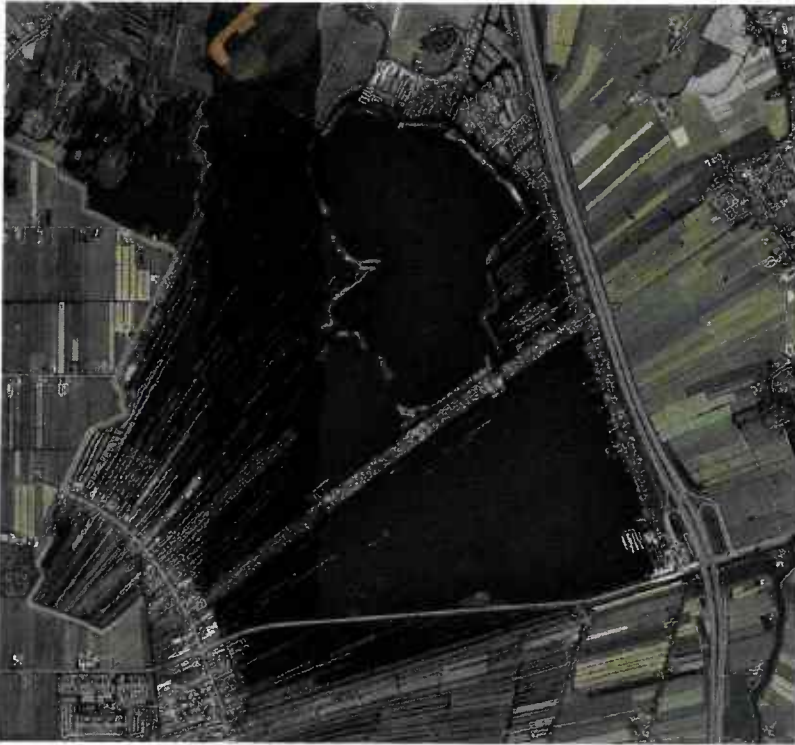
Luchtfoto planlocatie, bron: www.ruimtelijkeplannen.nl , geraadpleegd op 28 november 2023

De ontheffing kan worden verleend als de verwezenlijking van het gemeentelijk ruimtelijk beleid wegens bijzondere omstandigheden onevenredig wordt belemmerd in verhouding tot de met die regels te dienen provinciale belangen.